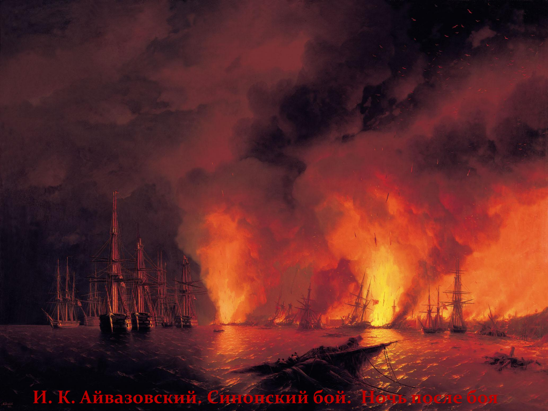
И. К. Айвазовский, Синопский бой. Ночь после боя