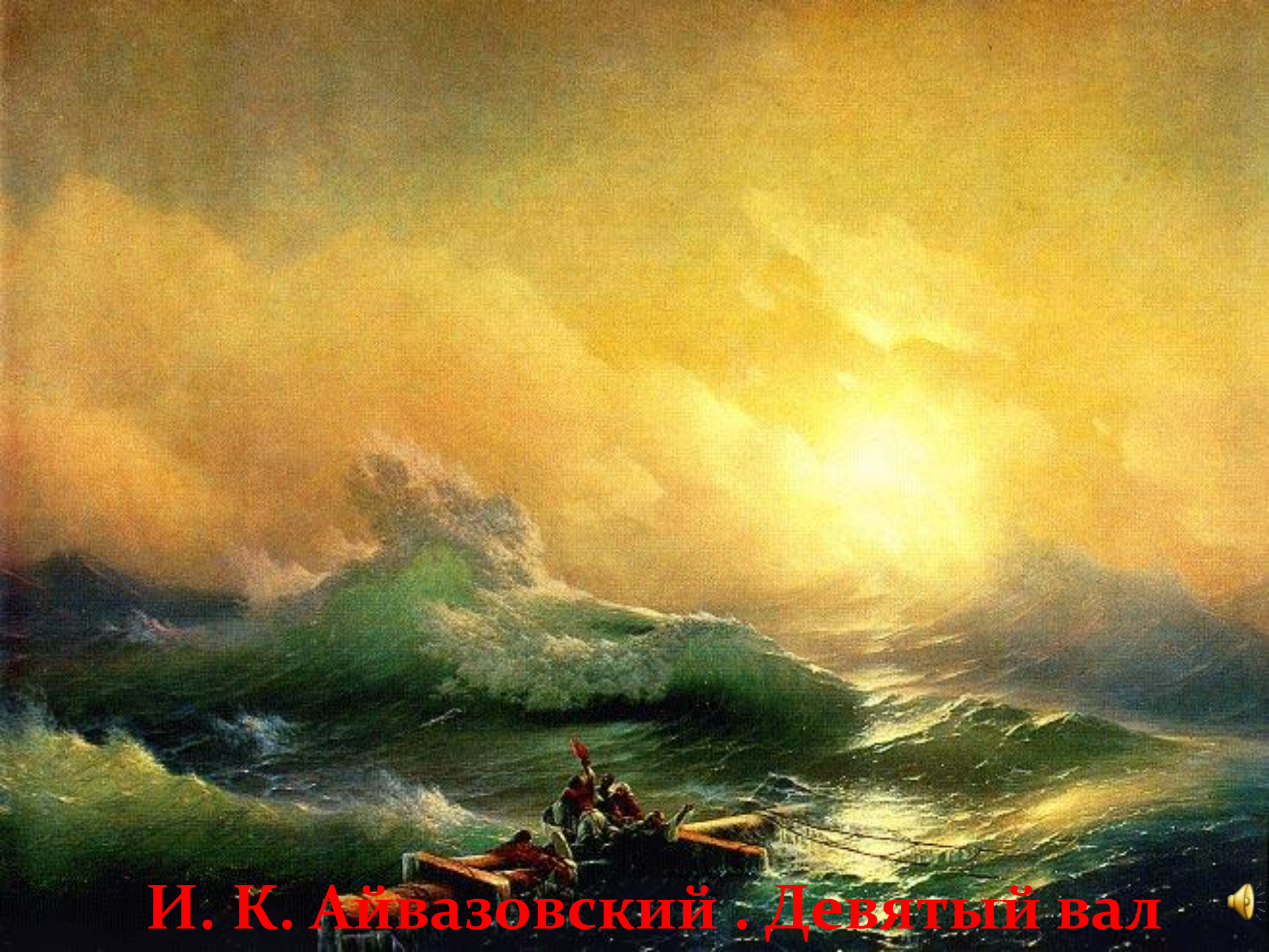
И. К. Айвазовский . Девятый вал