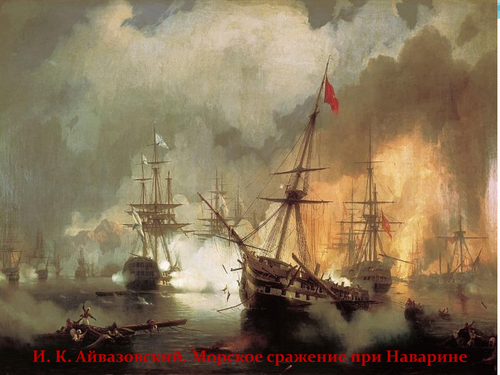
И. К. Айвазовский. Морское сражение при Наварине