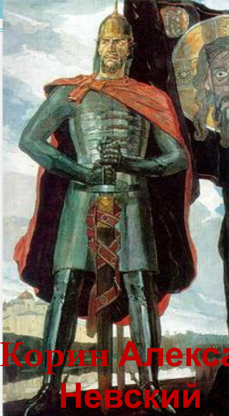
П. Корин Александр Невский