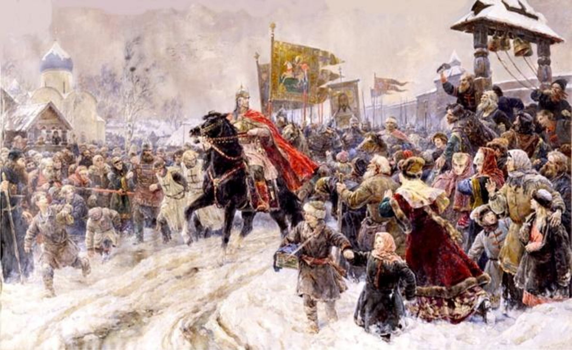
В. Серов «Въезд Александра Невского во Псков»