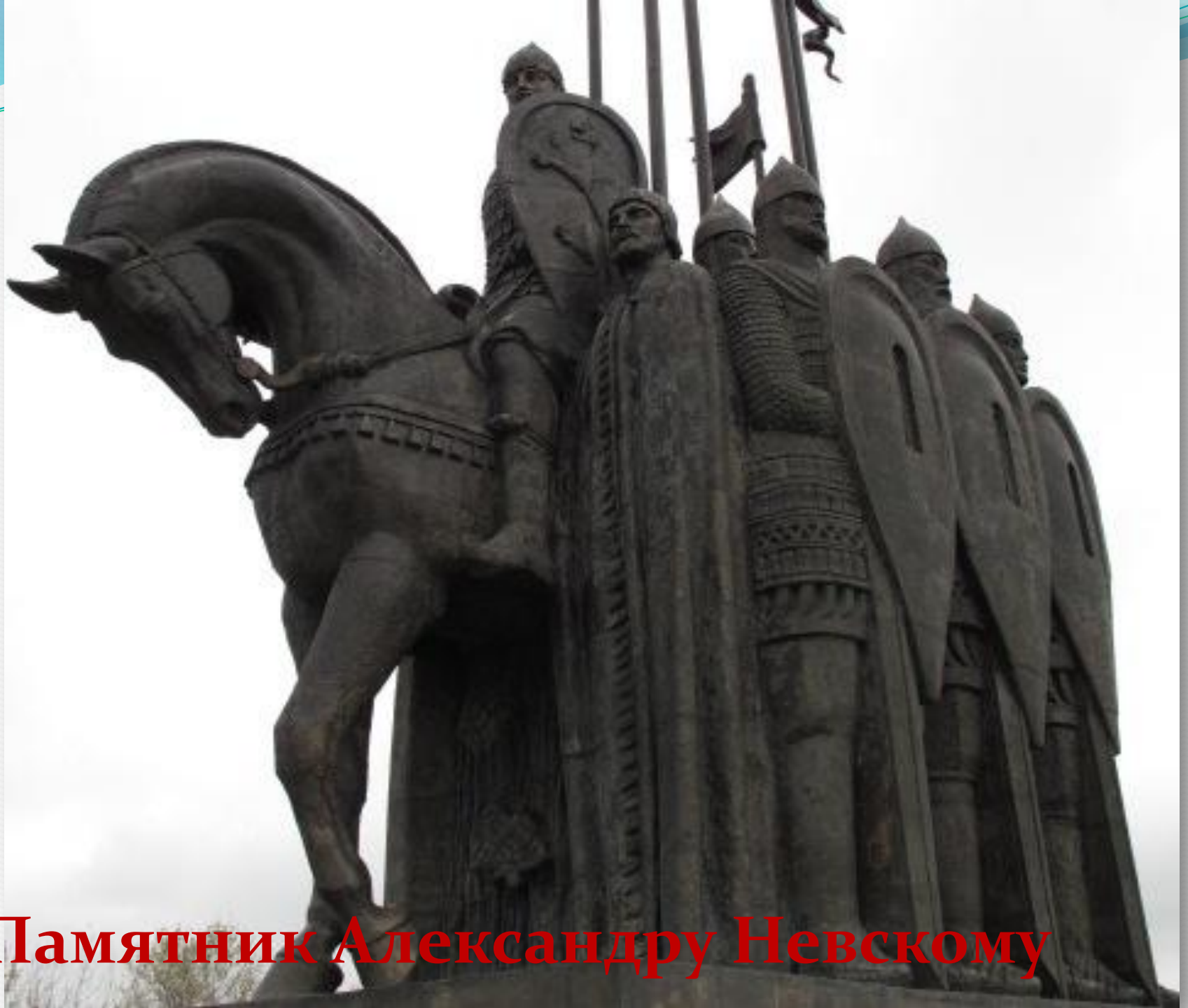
Памятник Александру Невскому