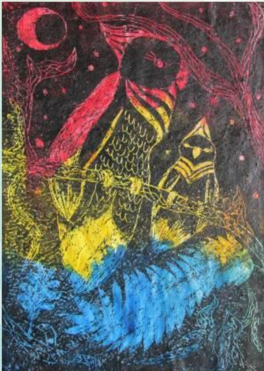
Неразлучники. Трач О. 5-В кл.