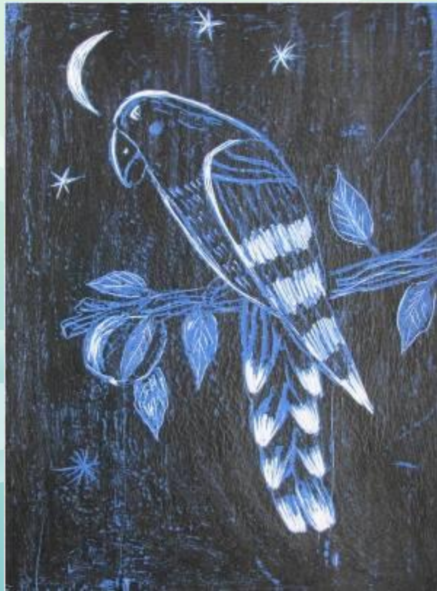
Попугай. Пушкарева Д. 5-В кл.