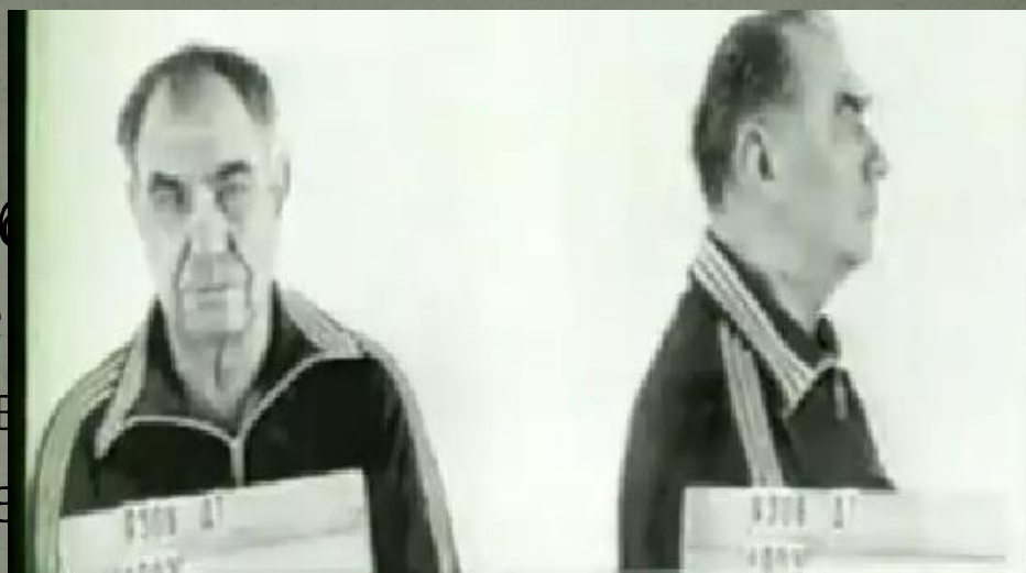
Дмитрий ЯЗОВ министр обороны СССР в 1991 г.