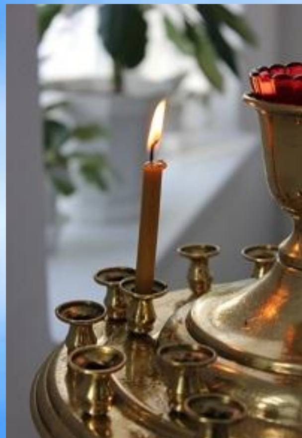
Царские врата, иконы, подсвечники, свечи в храме Великомученика и Целителя Пантелеймона