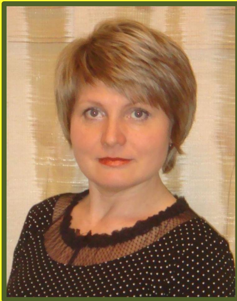
г.Улан-Удэ, 2013 год. Составила: Лебеданцева Евгения Викторовна, воспитатель высшей категории, д/с №234