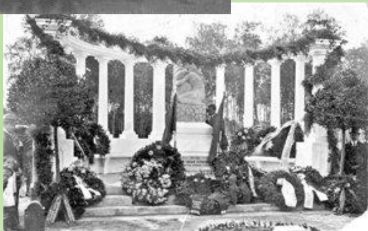
Памятник русским военнопленным в лагере Заган.

Питание в лагерях для военнопленных было скудным, пленные голодали. Помогали выжить посылки из дома, в которых были сухари и письма. Им разрешалось писать домой письма. Все письма написаны по-русски. О том как жили в плену писать запрещалось.