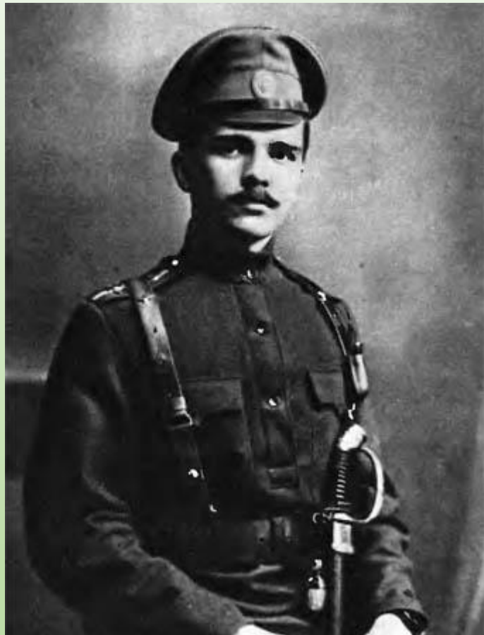
Прапорщик русской армии, 1917 год

Немало выходцев из Коми края окончили военные училища и получили первый офицерский чин прапорщика: