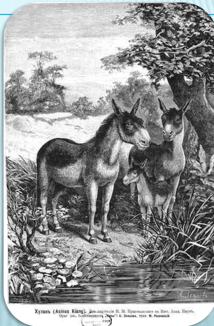
Хулань ( Asinus Kiang ). Дон-кабанчик П. М. Пржевальского из Шан. Алаш. Научн. Общ. рис. (собственность "Мир") А. Зейхера, грав. И. Раппельс