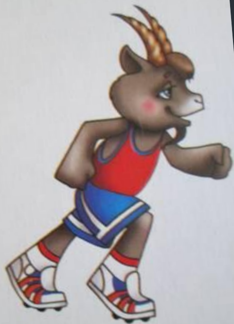
ЛЁГКАЯ АТЛЕТИКА ( БЕГ )