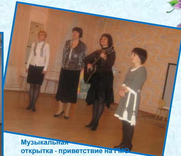
Музыкальная открытка - приветствие на ГМО «Иновационная деятельность ДОУ как условие творческой самореализации всех субъектов образовательного процесса»