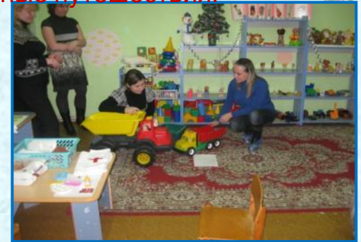
«С солнышком играем, детей любим»