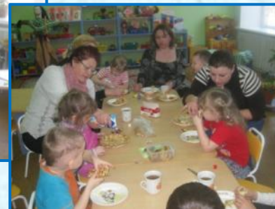
«Солнышко нас согревает, масленицу встречает»