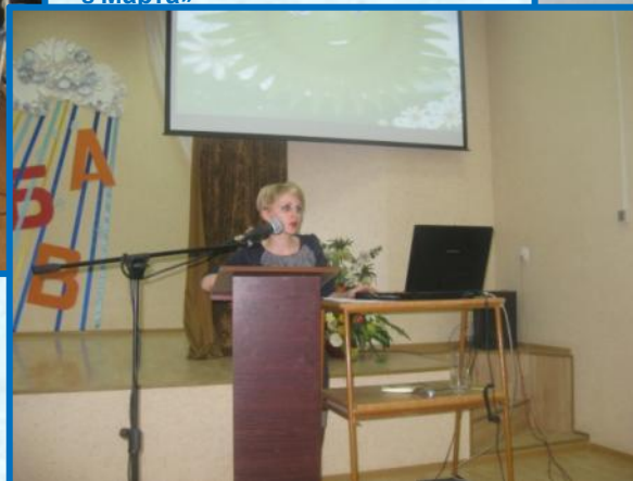
ВИПКРО Круглый стол «Иновационные процессы в дошкольном образовании» (режим СЗР)