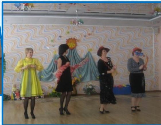
«Ах, мамочка, на саночках, каталася не с тем...» – музыкальное поздравление для сотрудников ДОУ в праздник 8 Марта»