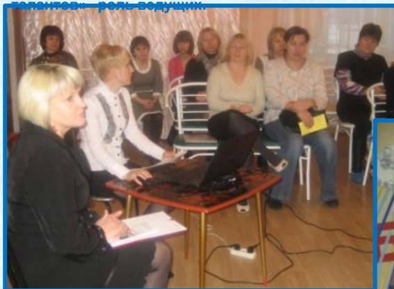
ГМО «Иновационная деятельность ДОУ как условие творческой самореализации всех субъектов образовательного процесса»