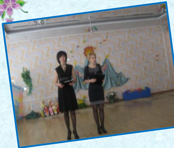
Фестиваль «Путешествие по Рябиновому созвездию талантов» – роль ведущих.