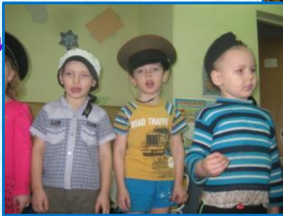
«Февральское солнышко светить стало ярко, всем малышам дарит подарки»