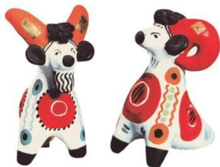
СВИСТУЛЬКИ – КОЗЁЛ И БАРАН

Наверное, поэтому и называли слободу Дымковской.