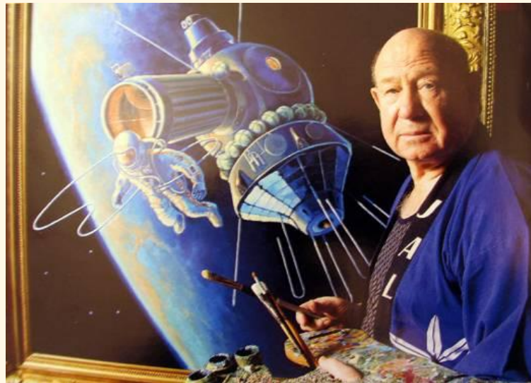
Алексей Архипович Леонов