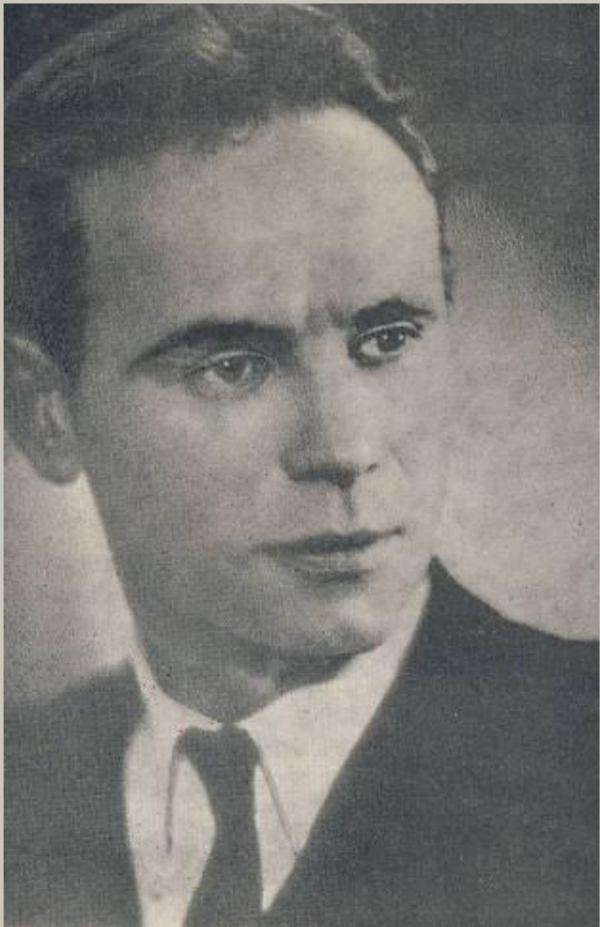
Константин Дмитриевич Воробьев