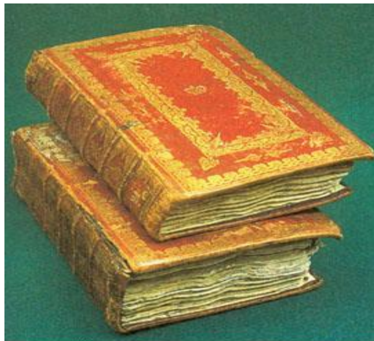
Книги записи именных указов из архива Петра I.