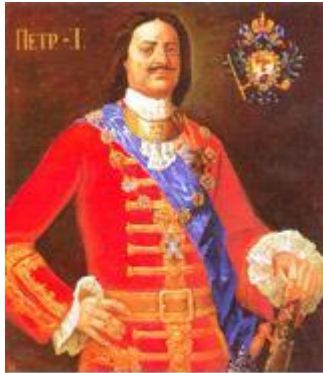
В.П. Псарев. Петр Великий