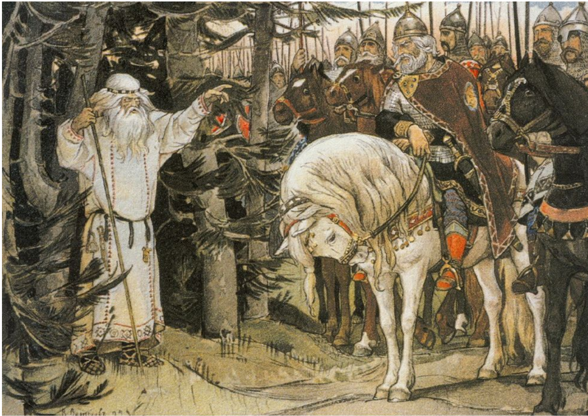
В.М.Васнецов. "Встреча князя Олега с волхвом". 1899 г.

Однажды Олег спросил у волхвов: «Отчего смерть мне приключится?» Один из волхвов отвечал князю: «Ты умрёшь от любимого своего коня». Тогда Олег приказал увести коня, никогда больше не садился на него и даже его не видел. Через много лет он узнал, что конь его давно уже пал. Услышав это, Олег посмеялся над предсказанием волхва и пожелал видеть кости своего коня.