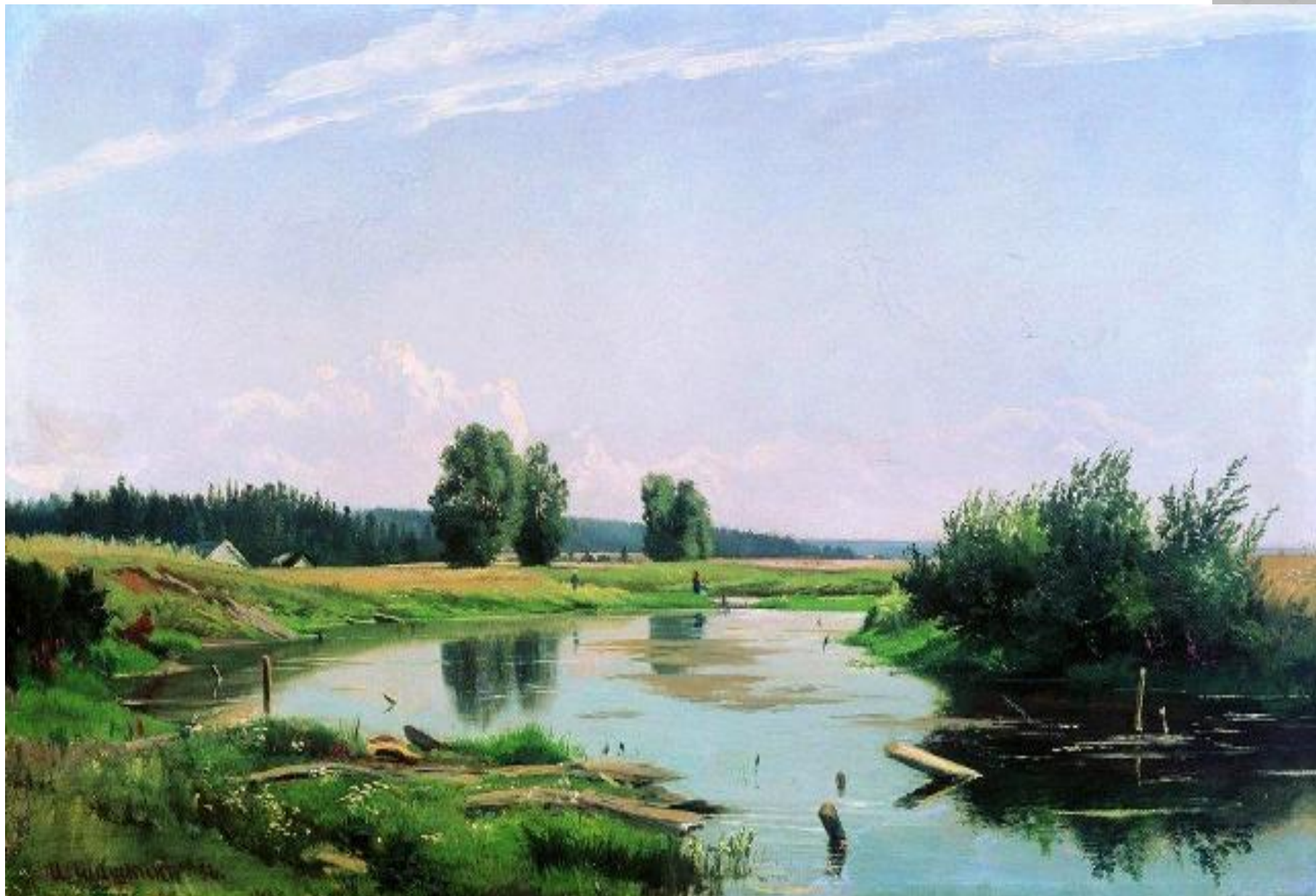
И.ШИШКИН ПЕЙЗАЖ С ОЗЕРОМ