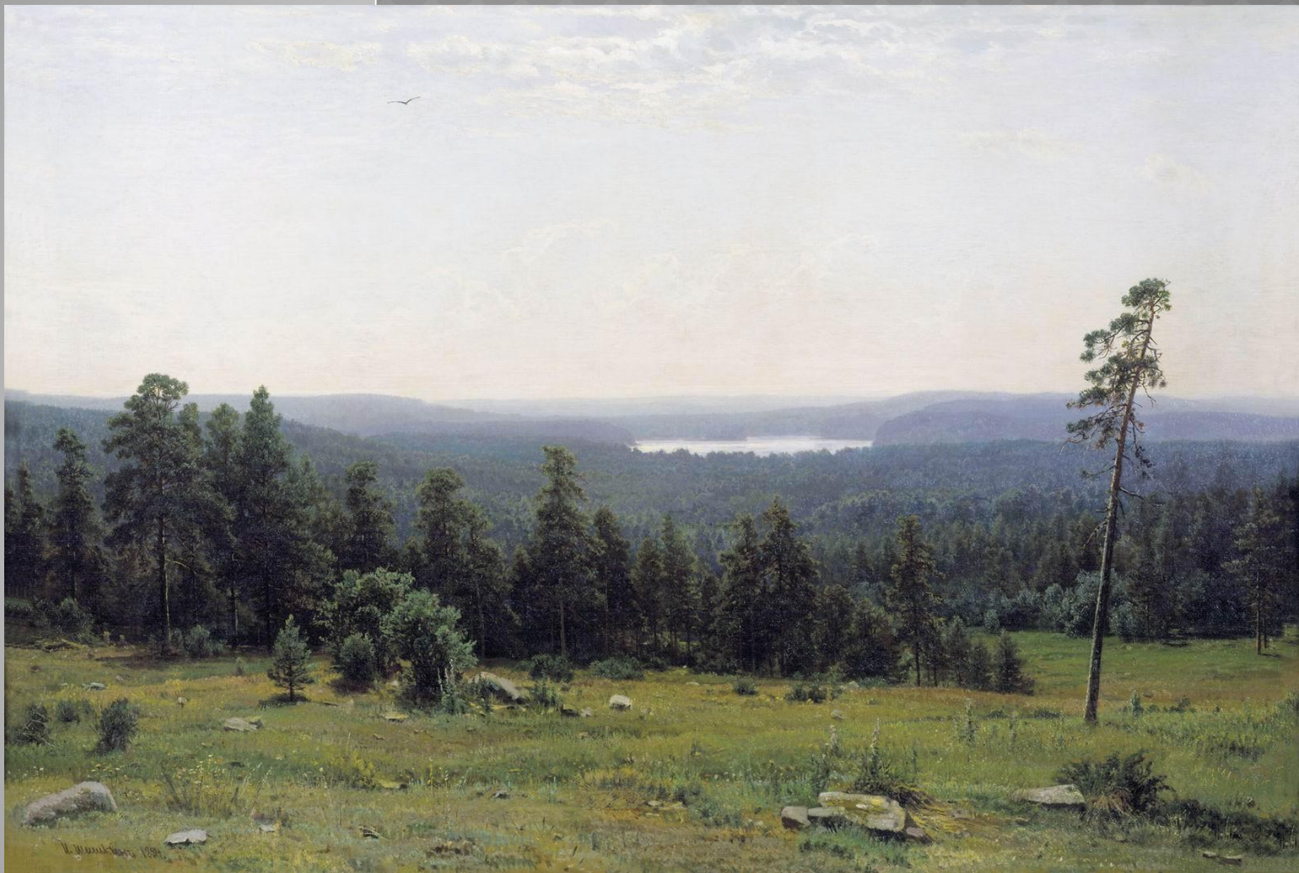
И. Шишкин «Лесные дали»