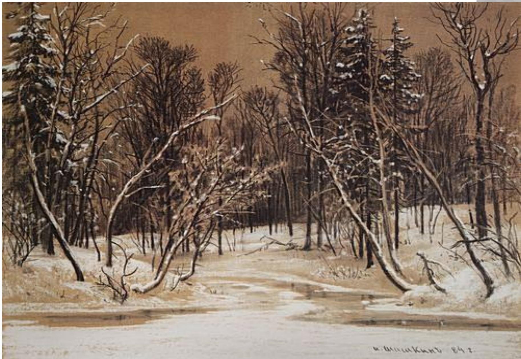
И. ШИШКИН «ЛЕС ЗИМОЙ»