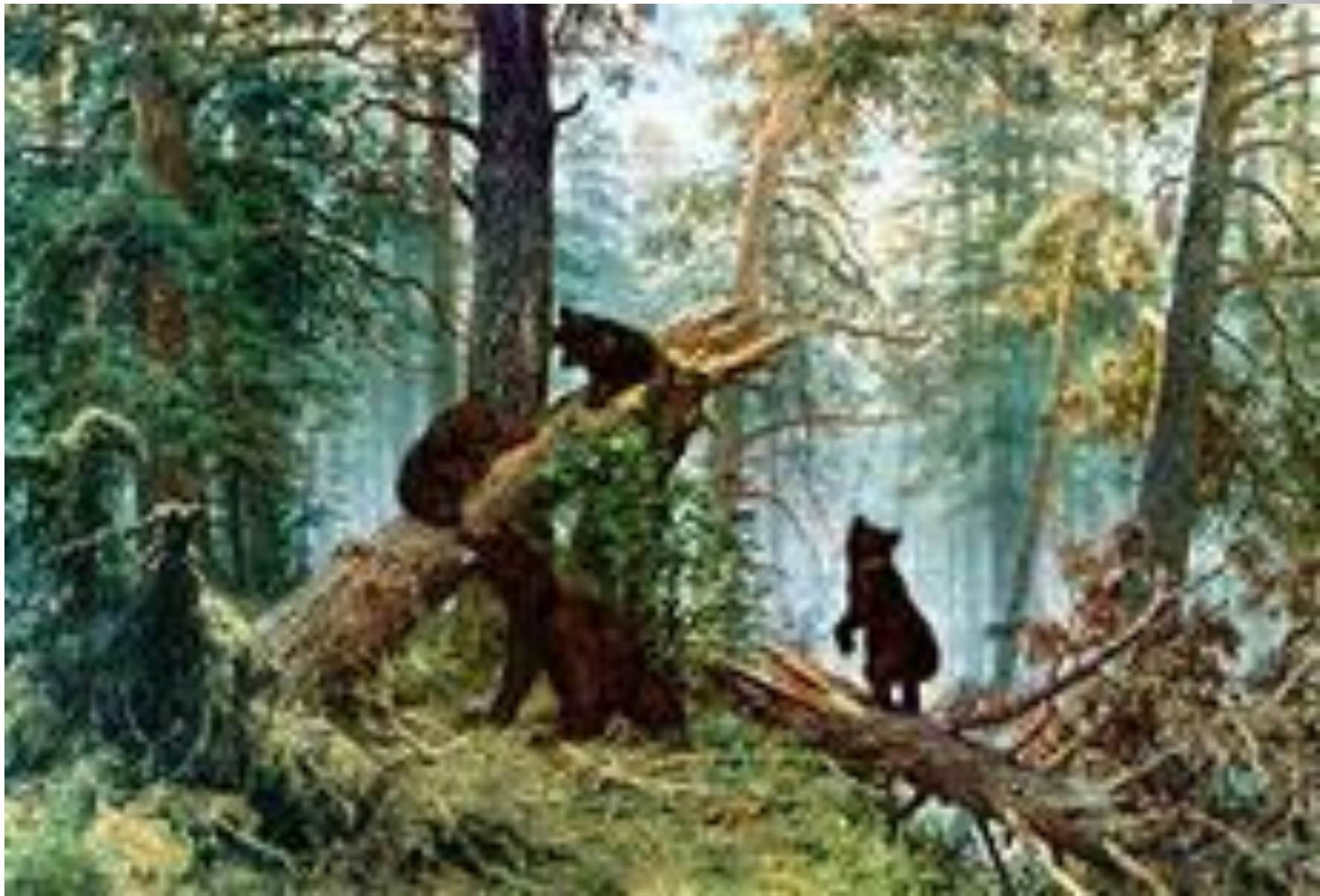
И. ШИШКИН «УТРО В СОСНОВОМ ЛЕСУ»