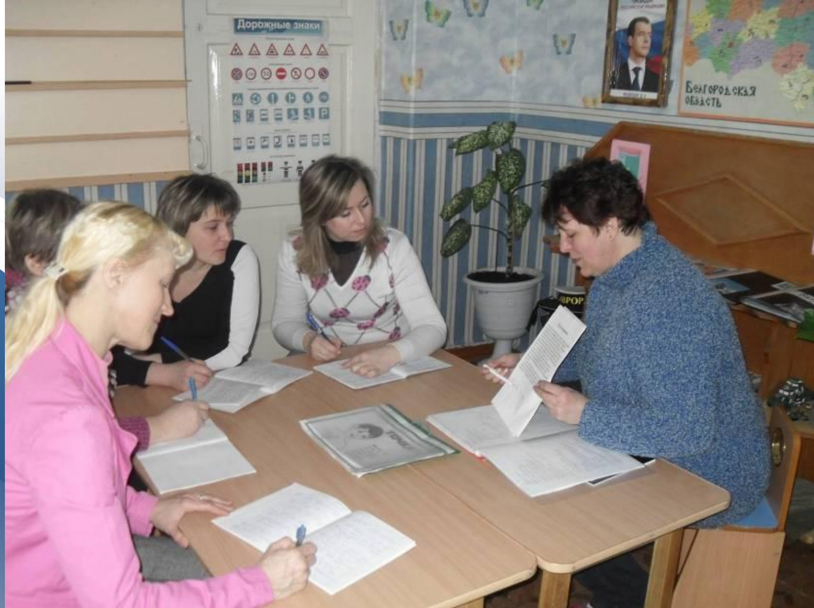
Круглый стол: «Профилактика двукостности»