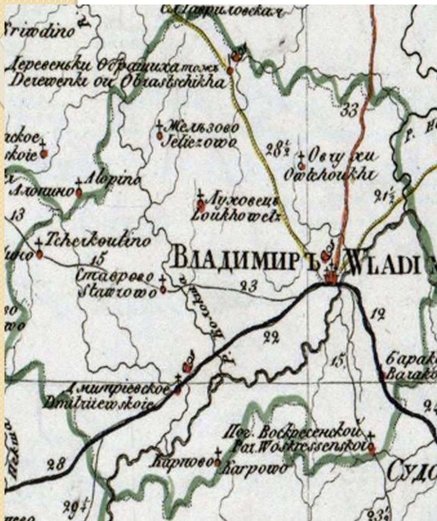
● Карта Владимирского уезда (XVII век)