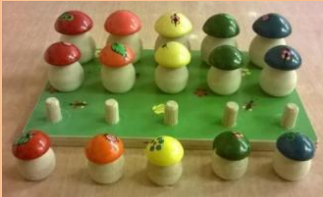
1 ШАГ : ТОЛЬКО МАЛЕНЬКИЕ ГРИБЫ СТАВЯТСЯ НАПРОТИВ СВОЕГО МЕСТА

Следует помнить, что ведущая игровая деятельность, периода от года до двух лет, носит манипулятивный характер.