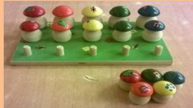
2 ШАГ : ТОЛЬКО МАЛЕНЬКИЕ ГРИБЫ СТАВЯТСЯ ВПЕРЕМЕШКУ СНИЗУ