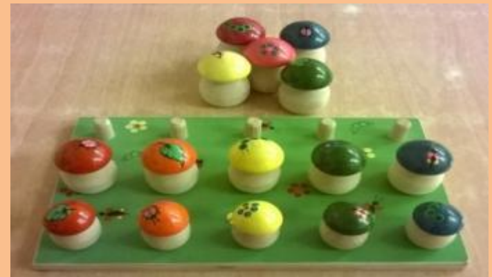
4 ШАГ : ТОЛЬКО БОЛЬШИЕ ГРИБЫ СТАВЯТСЯ ВПЕРЕМЕШКУ СВЕРХУ