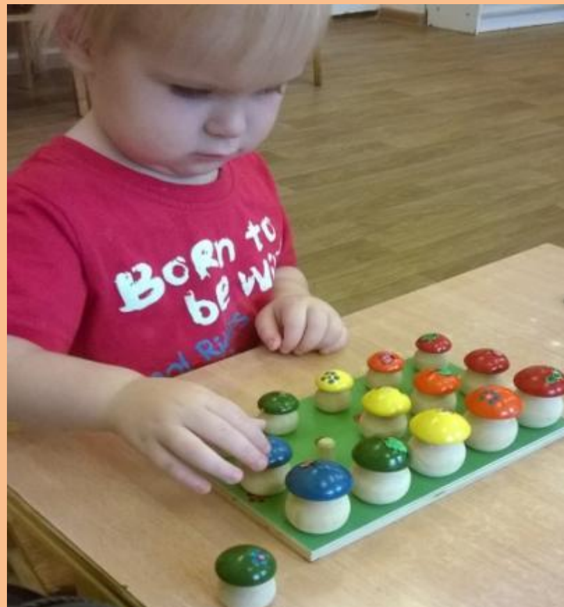
ФОТО №1 ПОКАЗЫВАЕТ ПРОЦЕСС ШАГ 9

10 ШАГ : БЕЗ ПОДСКАЗОК. ВСЕ ГРИБЫ СТАВЯТСЯ ВПЕРЕМЕШКУ ПЕРЕД РЕБЕНКОМ И ПОД ПОЛЯНОЙ.