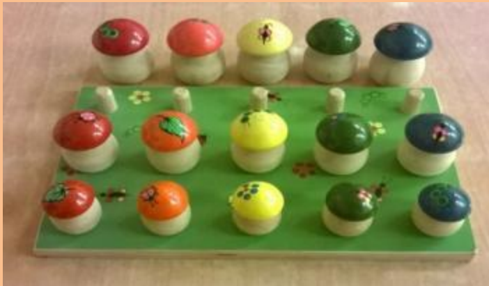
3 ШАГ : ТОЛЬКО БОЛЬШИЕ ГРИБЫ СТАВЯТСЯ НАПРОТИВ СВОЕГО МЕСТА