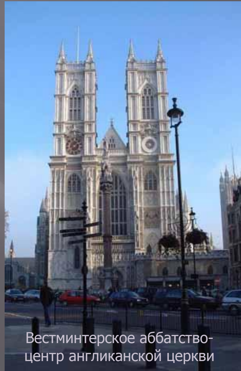
Вестминтерское аббатство-центр англиканской церкви

Статус государственной в Великобритании имеют англиканская церковь в Англии и пресвитерианская на территории Шотландии. В Уэльсе и Северной Ирландии государственных религий нет. Англиканская церковь, как одна из крупнейших ветвей протестантского христианства, приобрела официальный статус в XVI веке в период Реформации, когда её светским главой был признан британский монарх. Также к протестантским относятся так называемые «свободные церкви» (Free Churches): баптистская, церковь методистов, Армия спасения и др. Римско-католическая церковь была восстановлена в Великобритании в 1850 г. и сейчас насчитывает около 4000 церквей с наибольшим их количеством в Северной Ирландии. Таким образом, на долю христианства приходится 72% населения, на ислам (одна из самых больших общин в Западной Европе) – 3%, индуизм – 1%, иудаизм – 0,5% и 0,3% - буддизм. При этом более 20 процентов населения считают себя атеистами.