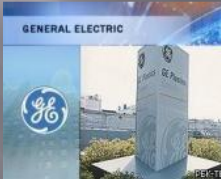
General Electric Company