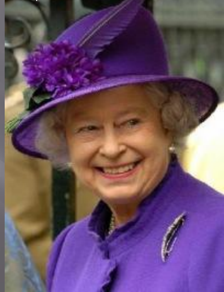
Королева Елизавета II