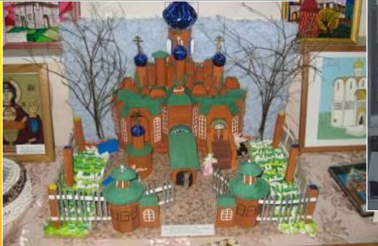
Поделки для Рождественских чтений