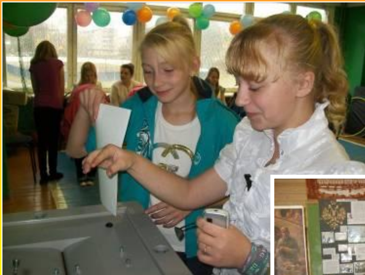
Деловая игра «Я избиратель»