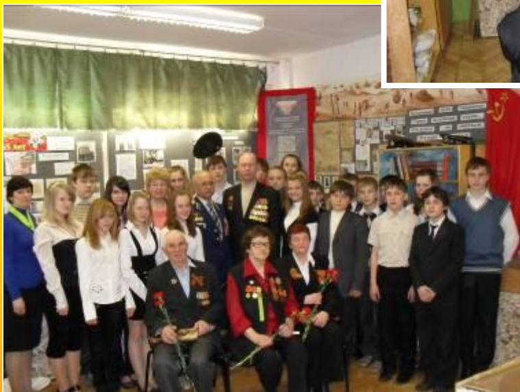
Встреча с ветеранами ВОВ и Афганистана