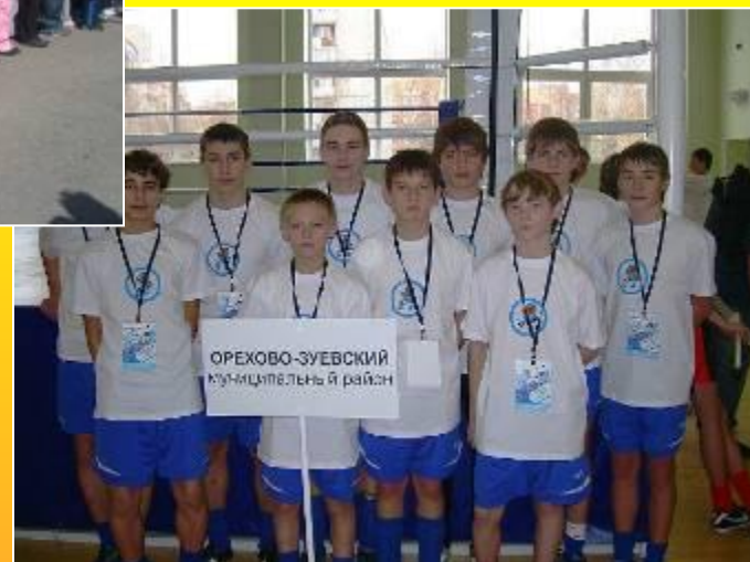
Образцовая футбольная команда школы