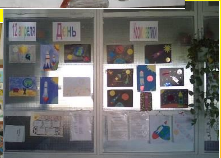
Выставка ко Дню космонавтики