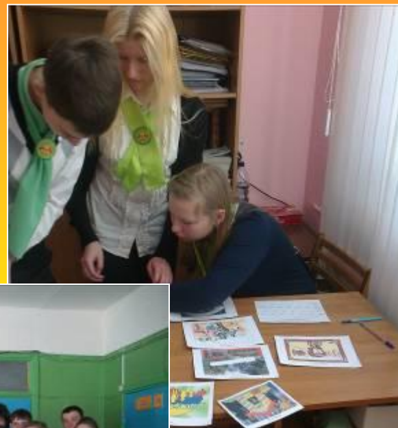
Районная игра «Игровые, деловые»