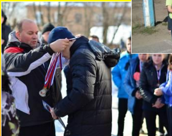
Награждение «Русичей» (2 место)