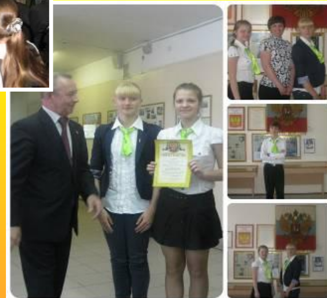
Областной конкурс «Мой музей»