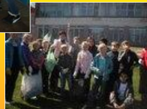
Субботник у 5а класса