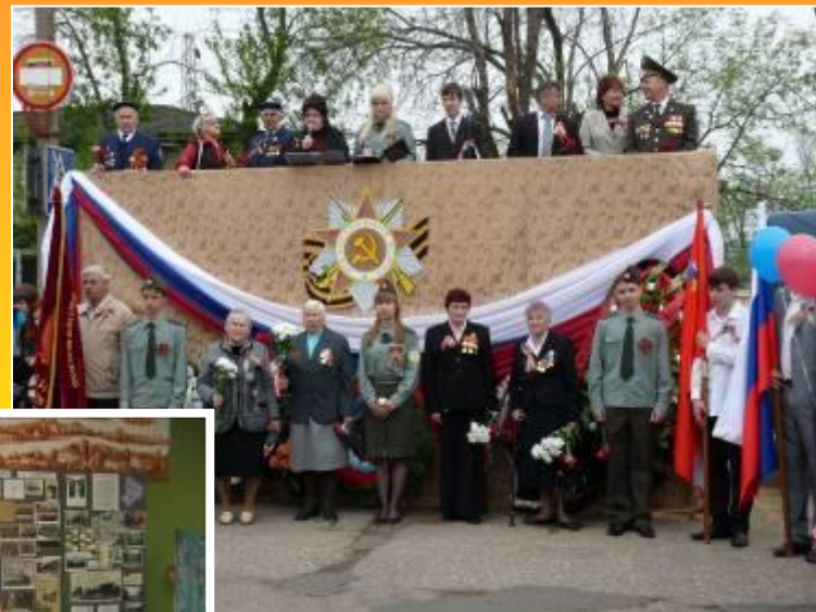
Парад ко Дню Победы