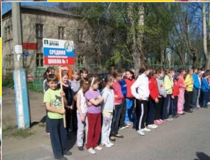
Пробег ко Дню Победы