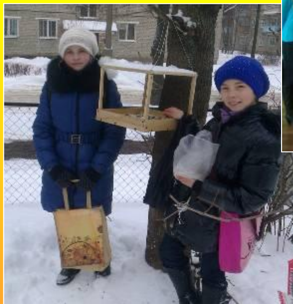
Акция «Птичья столовая»