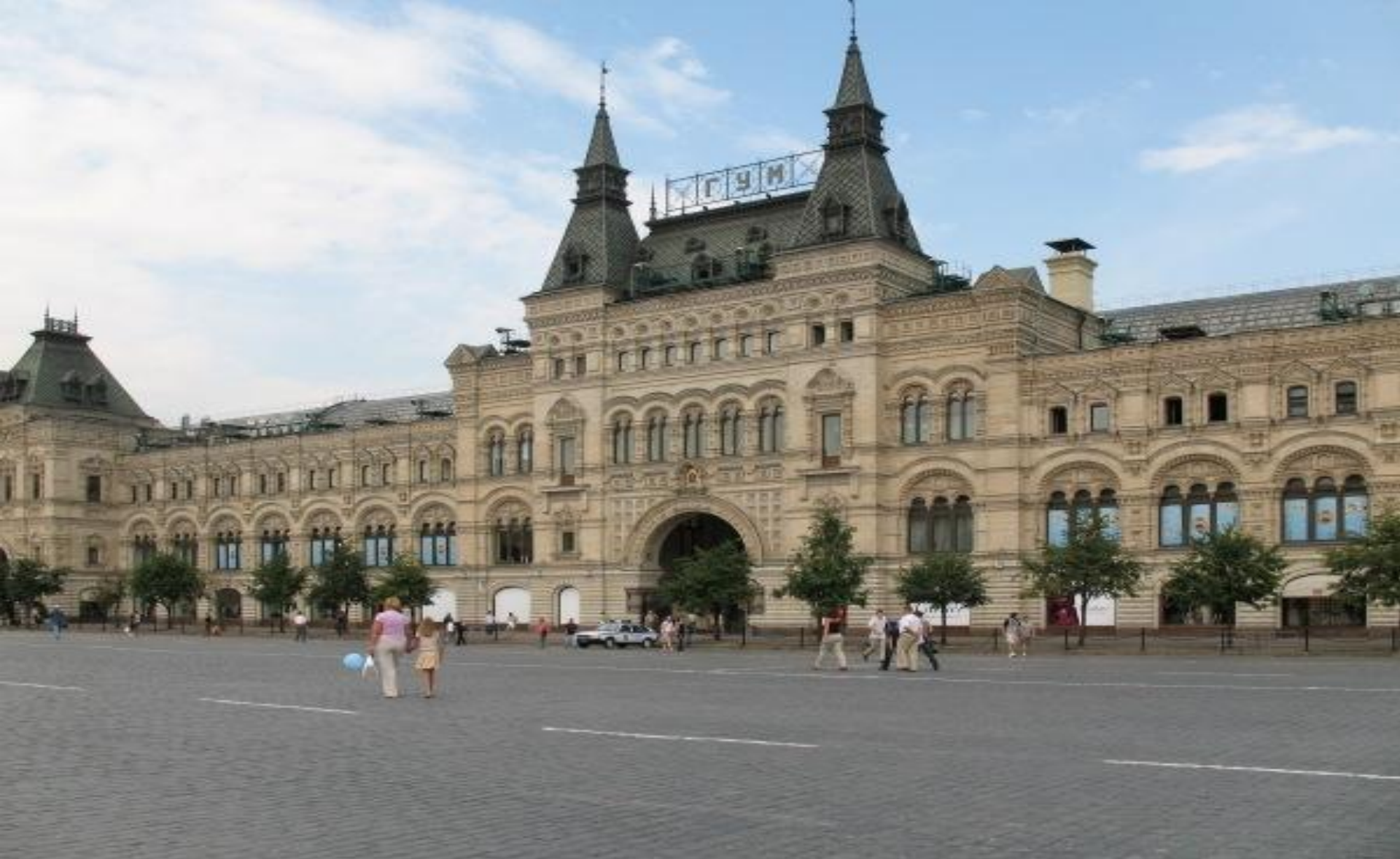
ВЕРХНИЕ ТОРГОВЫЕ РЯДЫ (ГУМ) 1893Г.