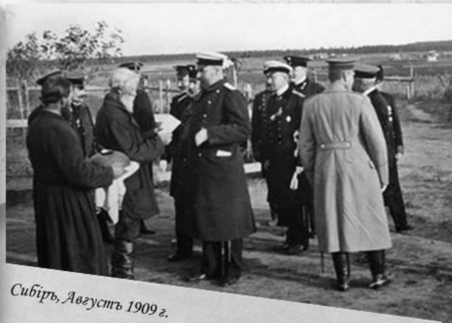
Сибирь, Августъ 1909 г.