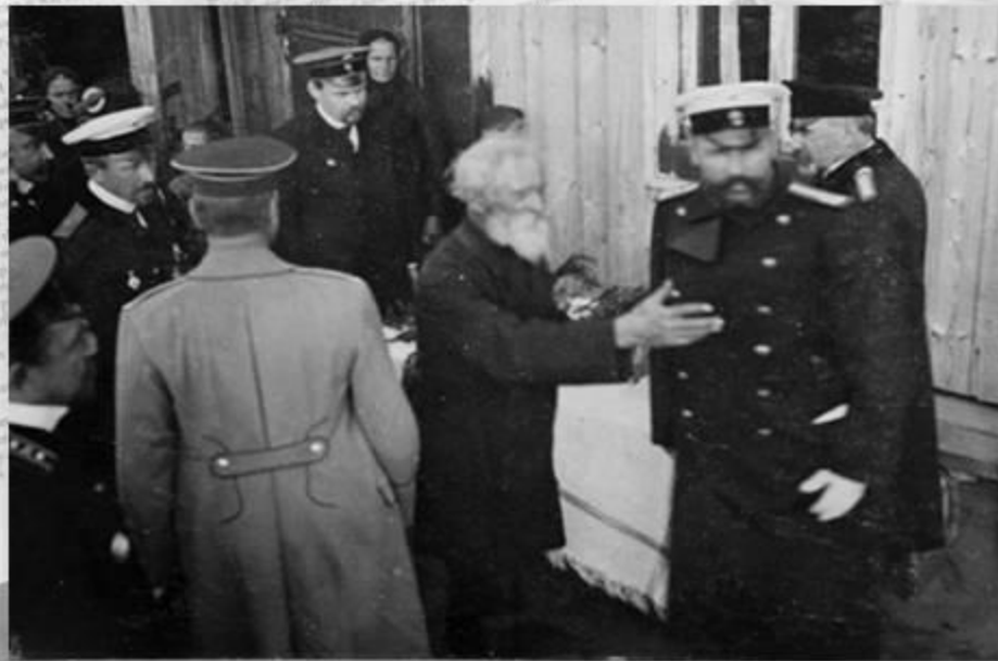
П. А. Столыпинъ выслушиваетъ объясненія подробностей хуторского хозяйства близъ Москвы, въ Августѣ 1910 г.