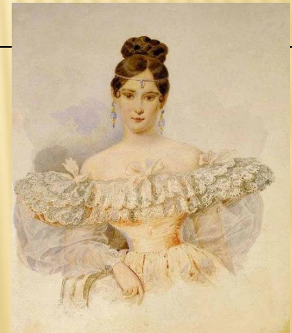
Наталья Николаевна Гончарова