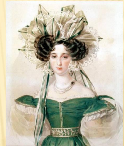
Елизавета Ксаверьевна Воронцова