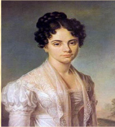
Мария Волконская (Раевская)