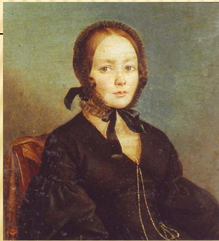
Анна Петровна Керн