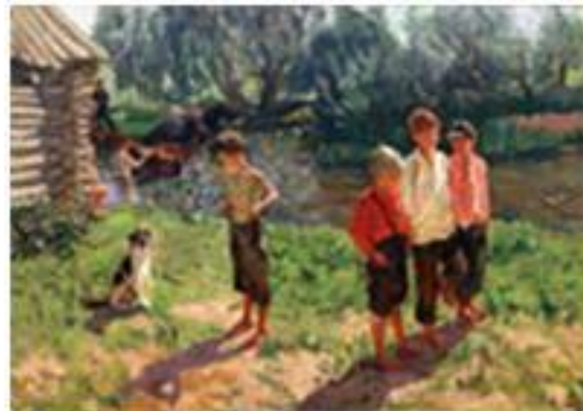
Тройка. Ребятишки у речки