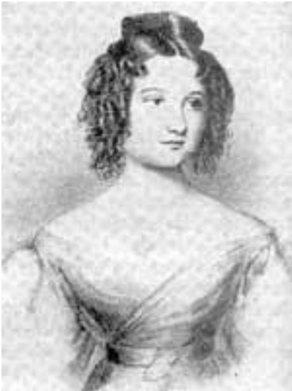
Ада Лавлейс, 1844 г. первая женщина-программист

«Аналитическая машина не претендует на изобретение чего-либо. Она может делать все то, что мы сумеем ей приказать»