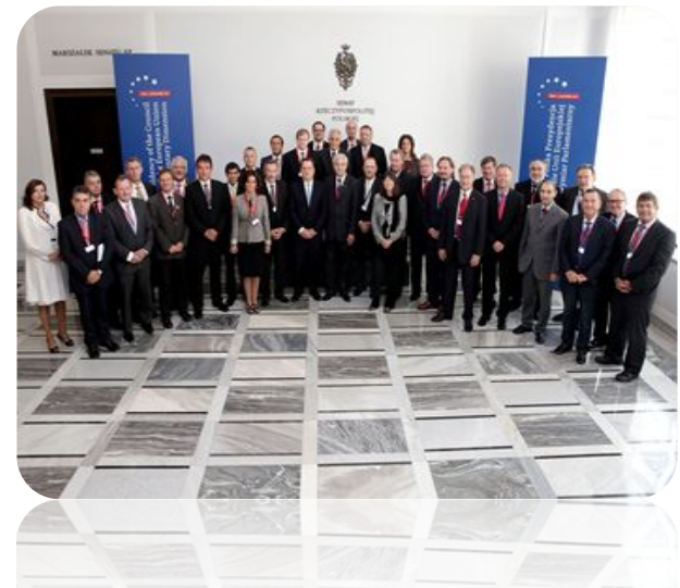
Spotkanie przewodniczących komisji właściwych do spraw rolnictwa parlamentów państw członkowskich Unii Europejskiej "Wspólna Polityka Rolna 2014-2020"