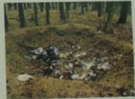
Несанкционированная свалка в лесу