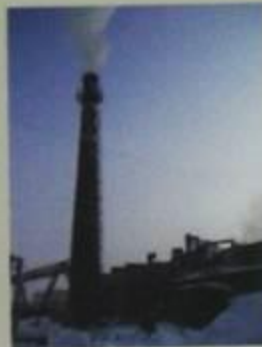
Котельные загрязняют воздух