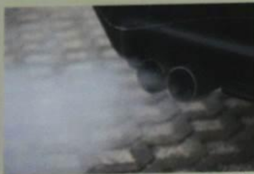
Выхлопные газы автомобилей загрязняют воздух