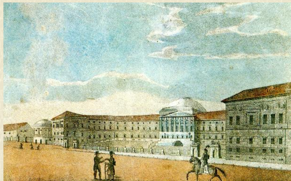
Московский университет. Неизвестный художник. 1820-е