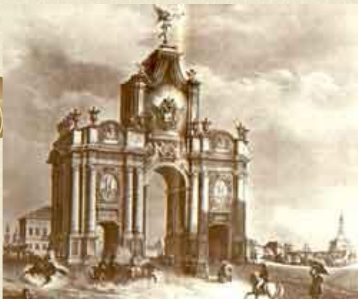
И.И. Вивьен. Москва. Красные ворота.

С 1827 года Лермонтов живет в Москве. Он учится в Московском благородном пансионе, позднее в Московском университете на нравственно-политическом, затем - на словесном отделении.