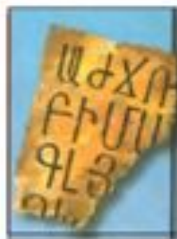
Письмо на пергаменте