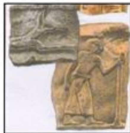
Письма в картинках