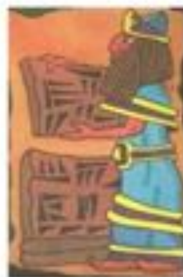
Письма на глине