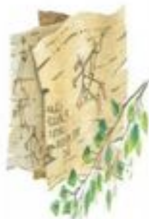
Письма на бересте