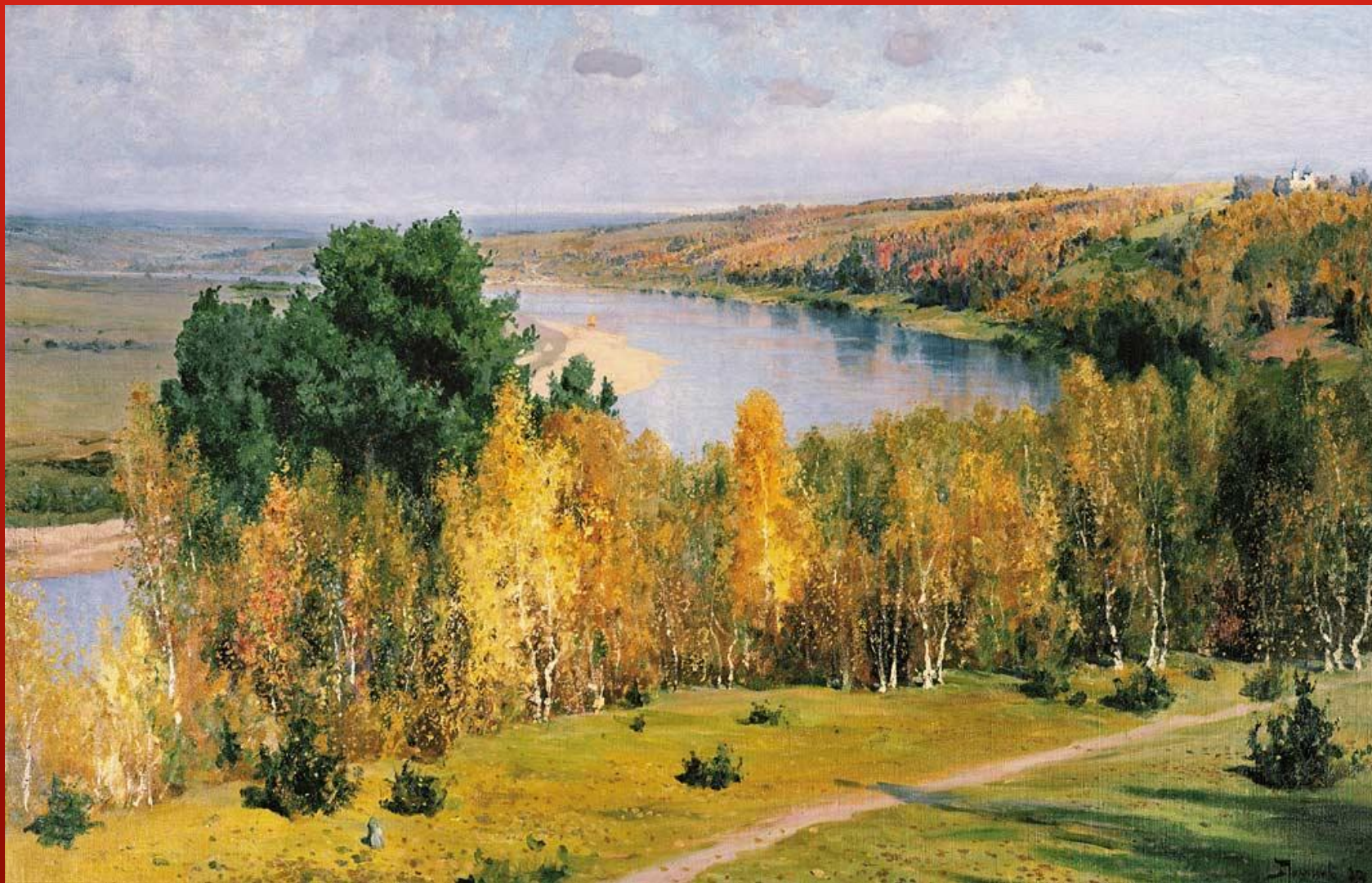
ЗОЛОТАЯ ОСЕНЬ. ПОЛЕНОВ В. Д. 1893Г.