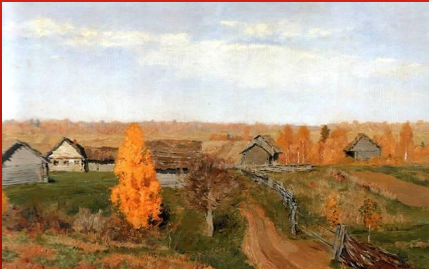
ЗОЛОТАЯ ОСЕНЬ. СЛОБОДКА. ЛЕВИТАН И. И. 1889г.