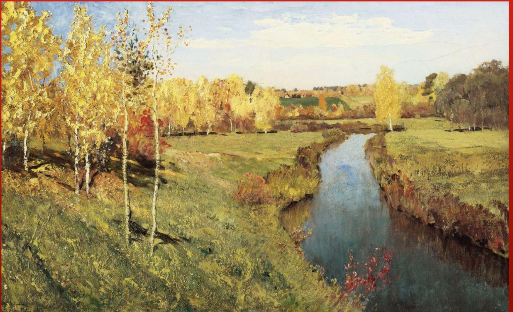
ЗОЛОТАЯ ОСЕНЬ. ЛЕВИТАН И. И. 1895г.