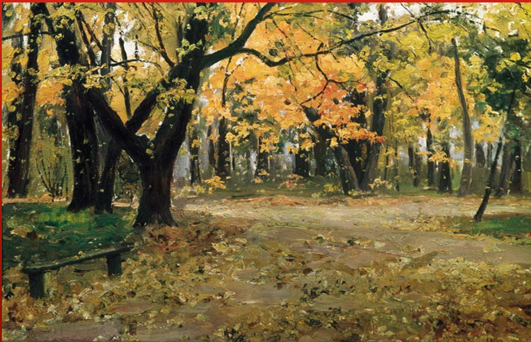
В АБРАМЦЕВСКОМ ПАРКЕ. ОСТРОУХОВ И. С.