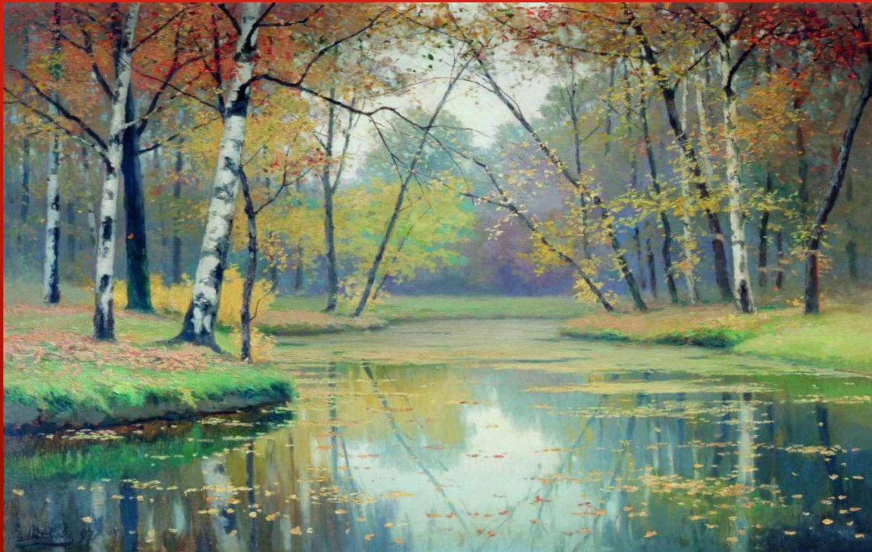
ОСЕННИЙ ПЕЙЗАЖ. ВОЛКОВ Е. Е.