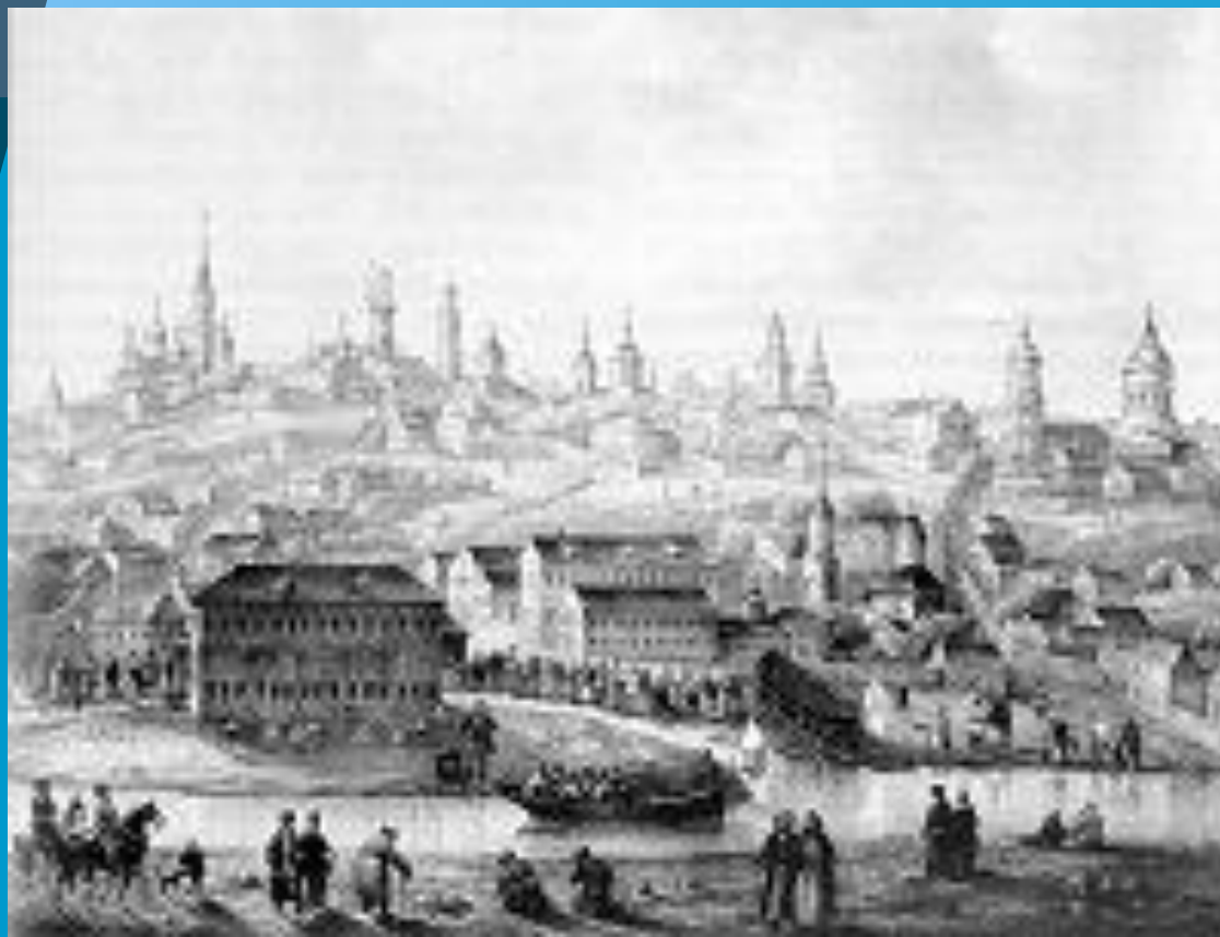
Воронеж в XVII веке