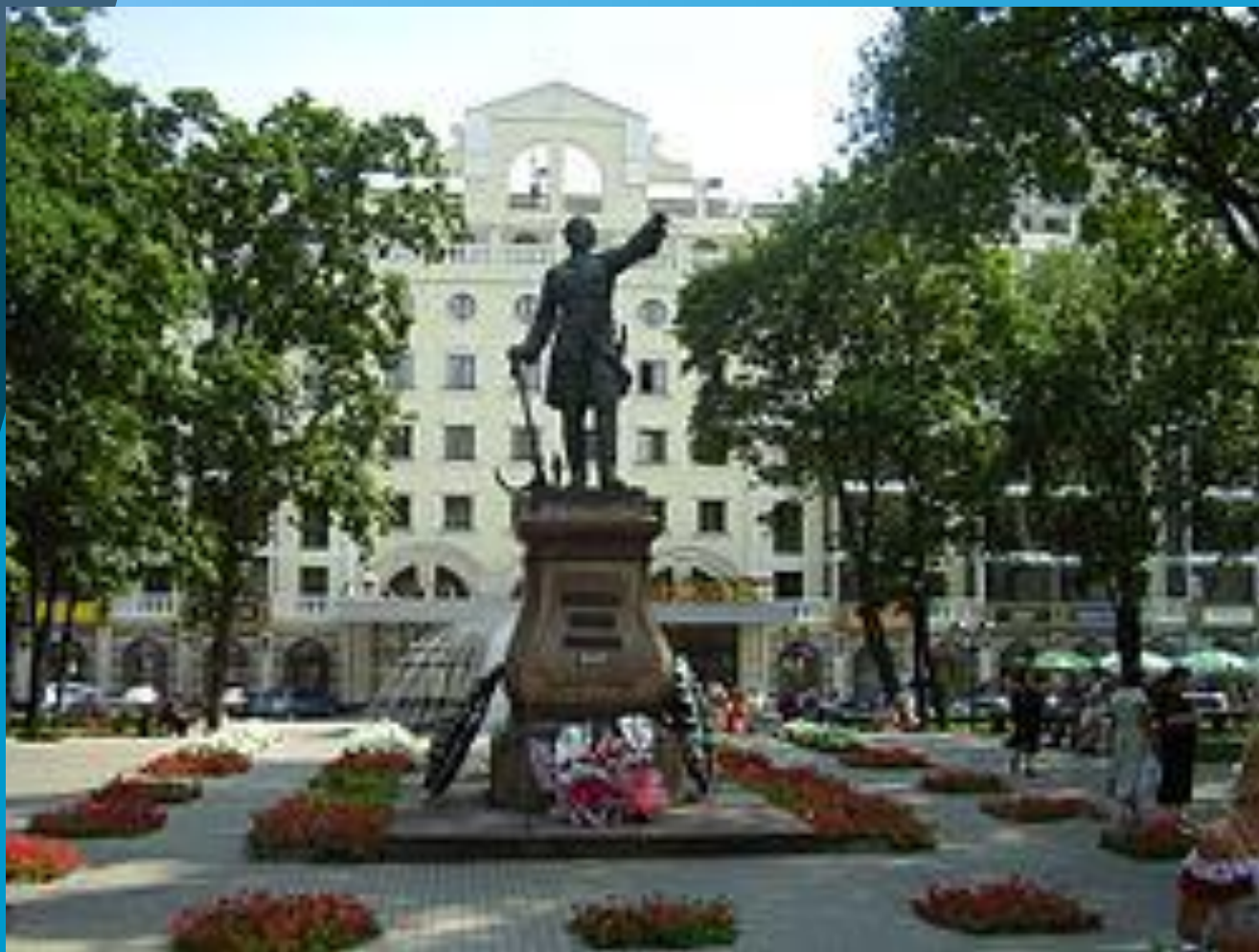
Памятник Петру I в Кольцовском сквере