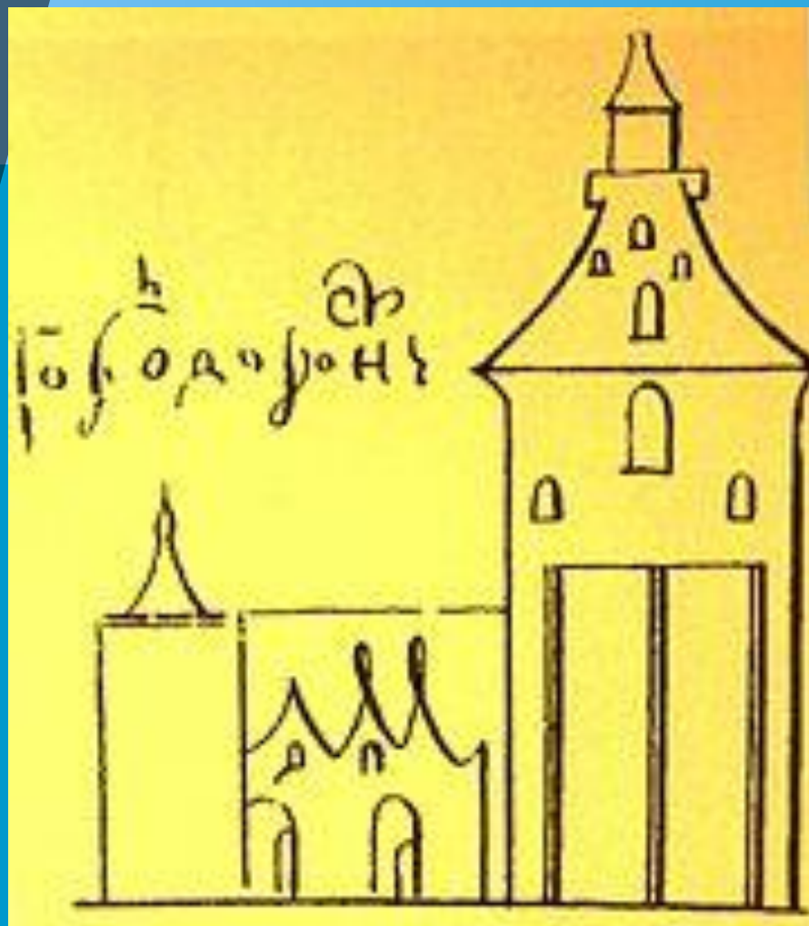
Крепость Воронежа XVII века