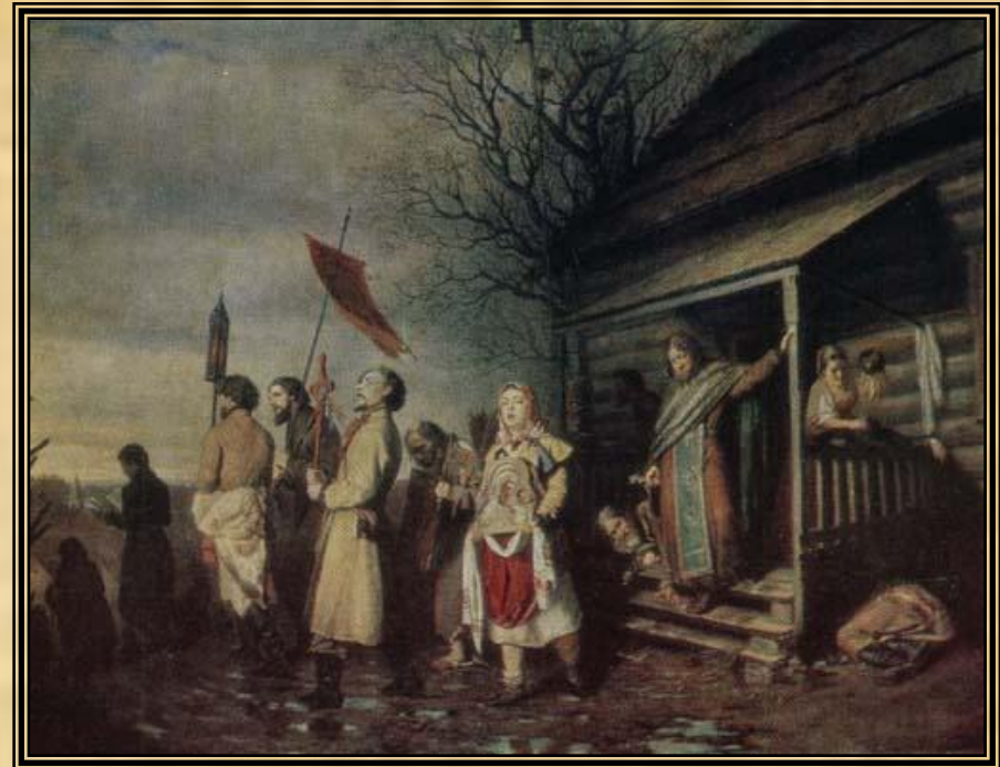
« Сельский крестный ход на Пасху» 1861г.