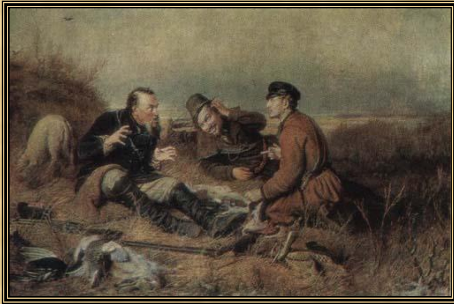
« Охотники на привале»1870г.