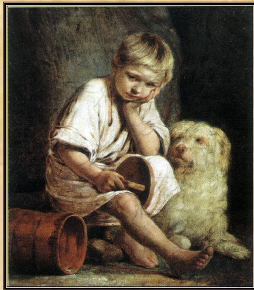
«Вот - те и батькин обед»