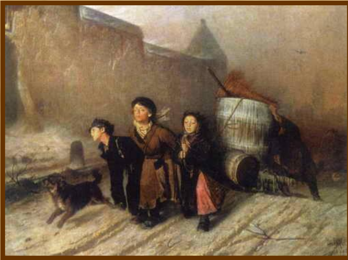
« Тройка ».