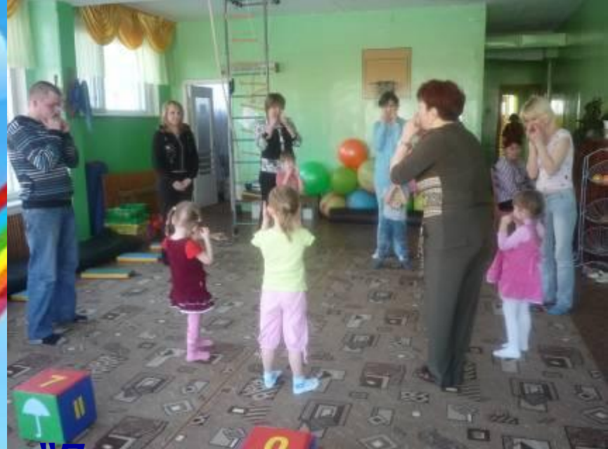
“Путешествие в страну здоровья”