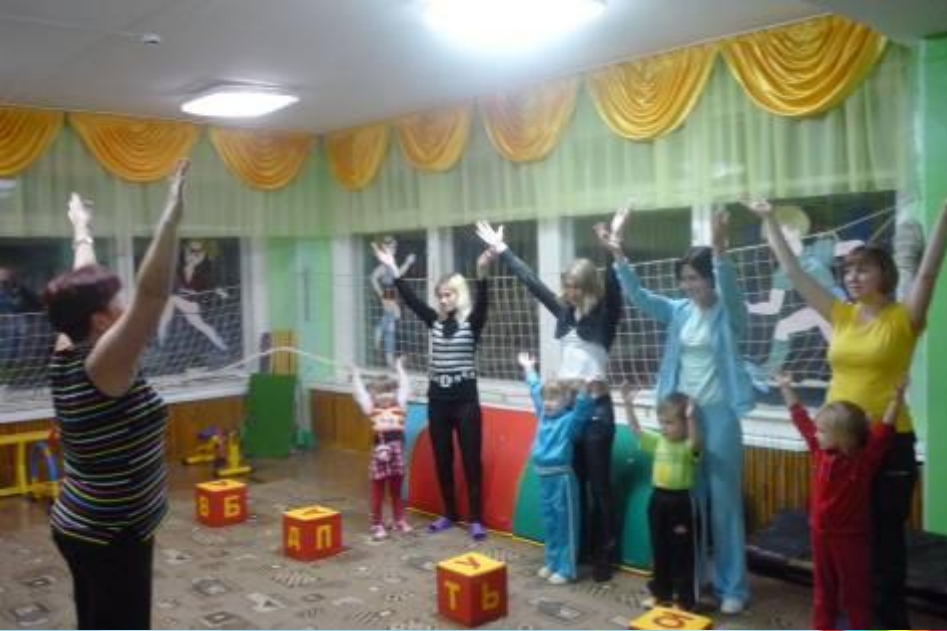
“Физкультура с мамой”