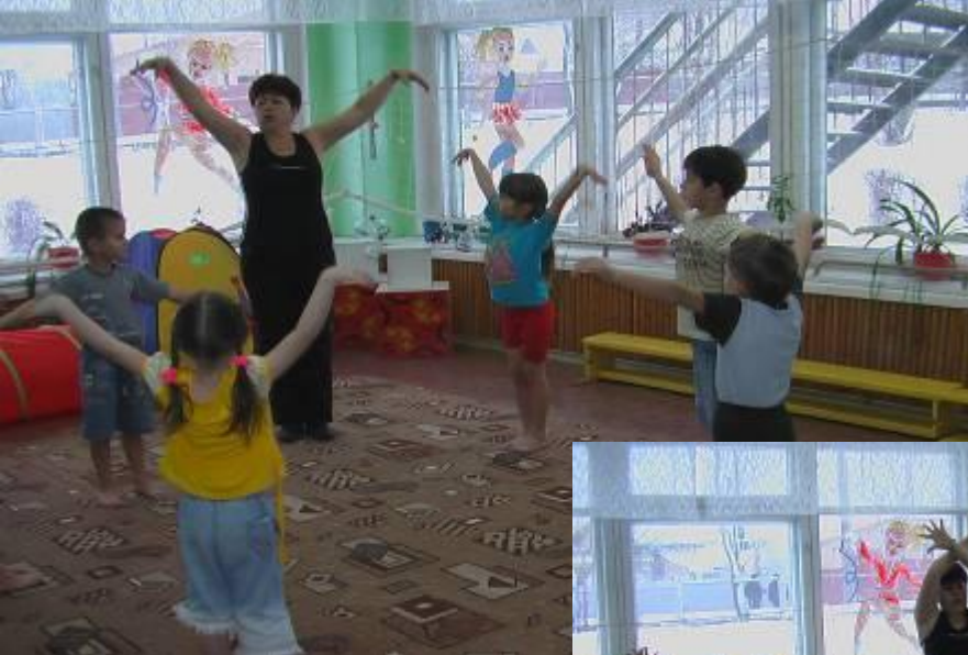
“Птица в полете”