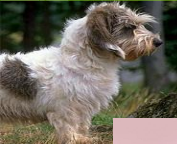
Toby the dog