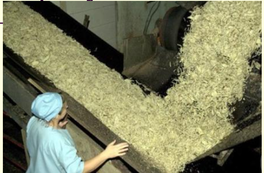
Переработка сах. свеклы

Почти вся продукция сельского хозяйства перерабатывается на месте. В ряде случаев мощности предприятий пищевой промышленности так велики, что позволяют использовать не только местное сырье (например, сахарная промышленность перерабатывает импортный сахар-сырец).