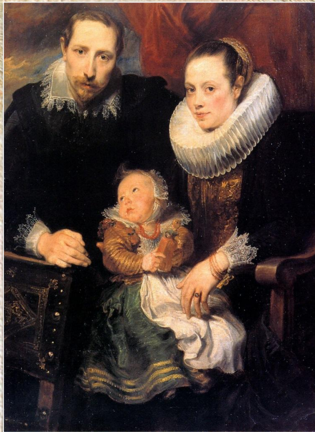
Антонис ван Дейк «Семейный портрет»