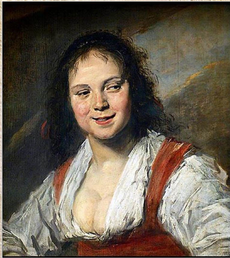
Франс Халс «Цыганка»