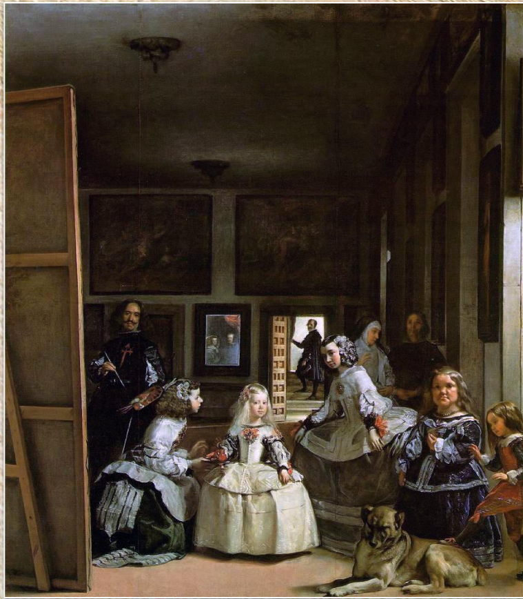
Диего Веласкес «Менины»