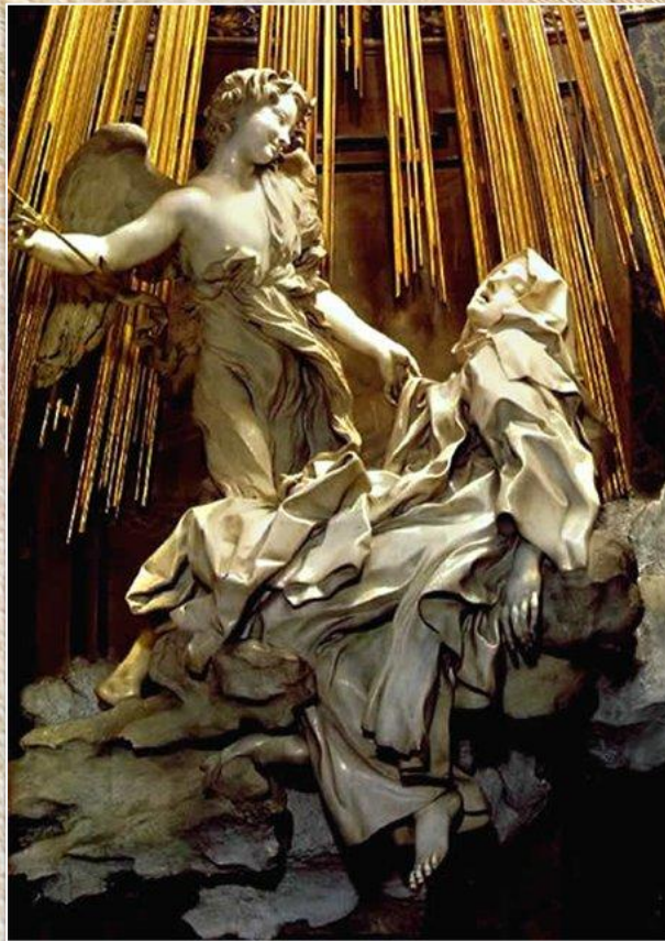
Лоренцо Бернини «Экстаз святой Терезы»