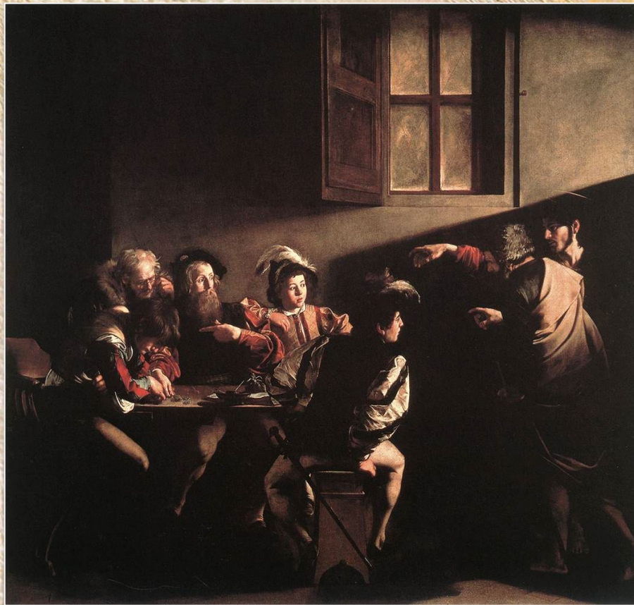
Караваджо «Призвание апостола Матфея»