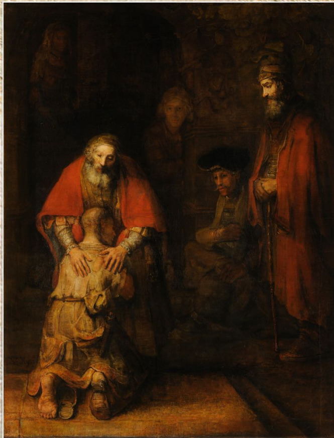
Рембрандт ван Рейн «Возвращение блудного сына»