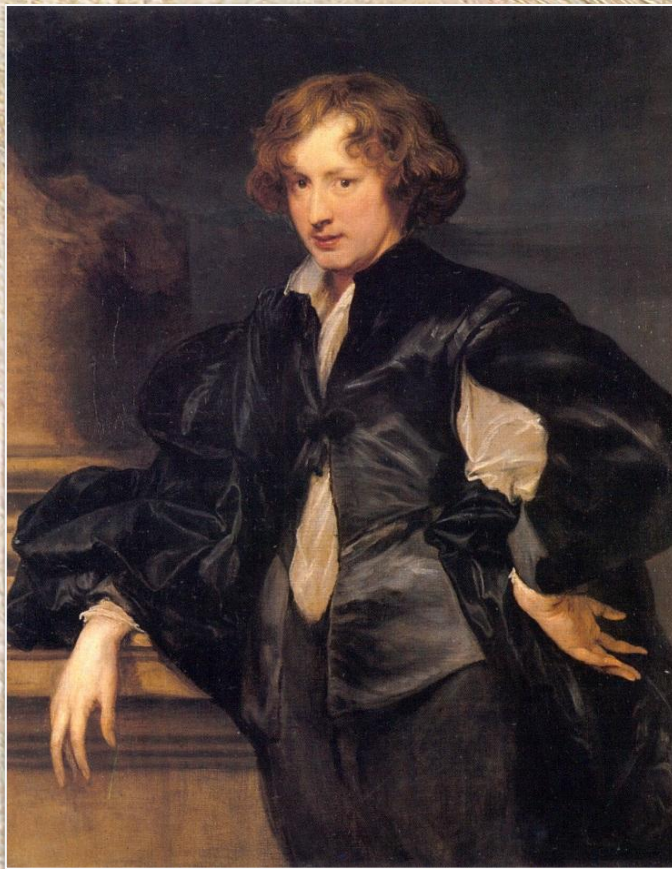
Антонис ван Дейк «Автопортрет»