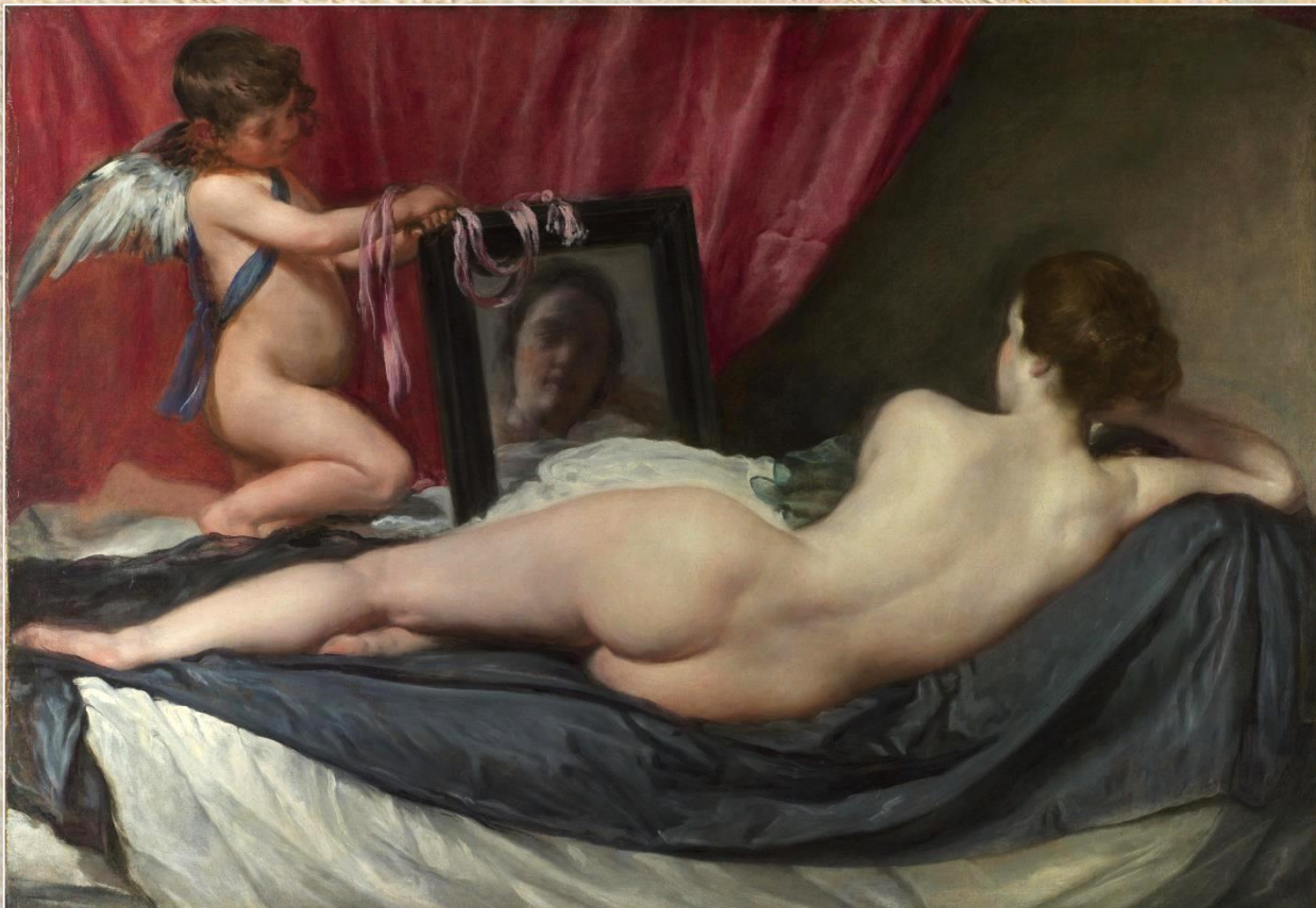
Диего Веласкес «Венера перед зеркалом»