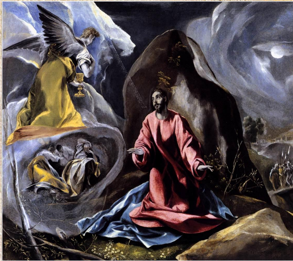
Эль Греко «Моление о чаше»