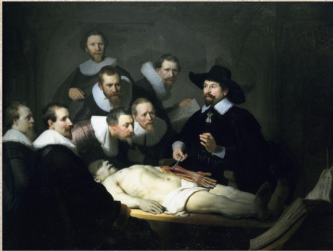
Рембрандт ван Рейн «Урок анатомии доктора Тульпа»