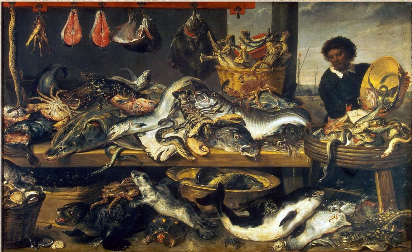
Франс Снейдерс «Торговец рыбой»