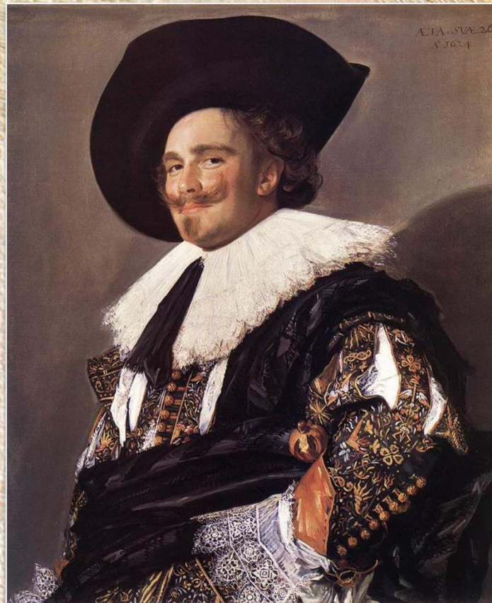
Франс Халс «Улыбающийся кавалер»