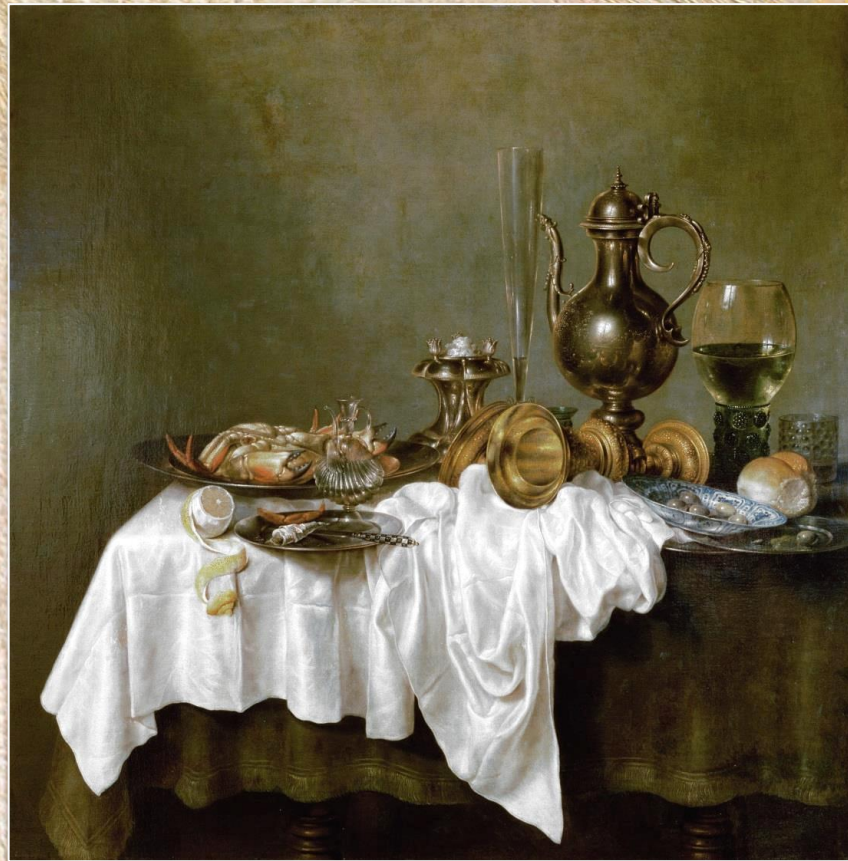
Виллем Клас Хеда «Натюрморт с крабом»