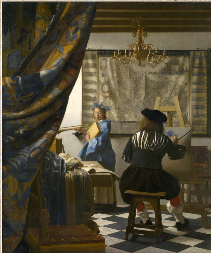
Ян Вермеер «Аллегория живописи»