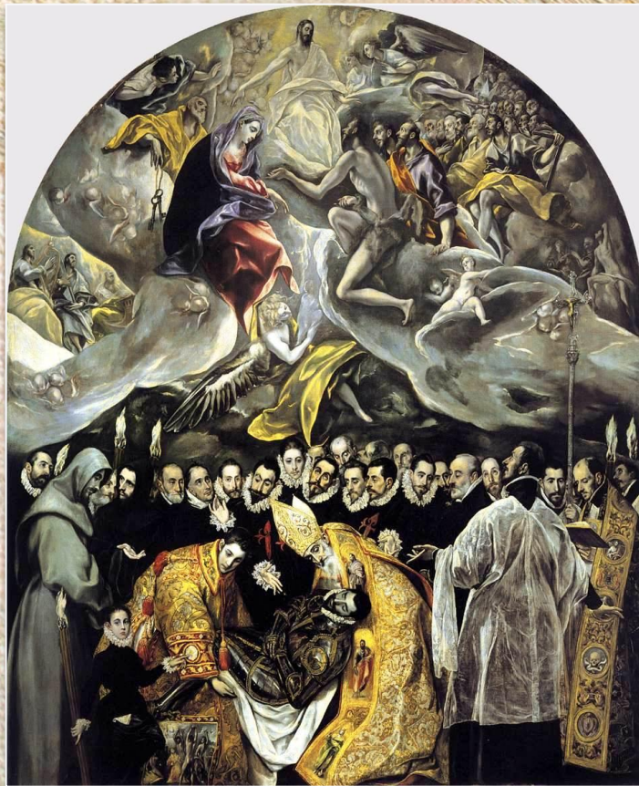
Эль Греко «Погребение графа Оргаса»