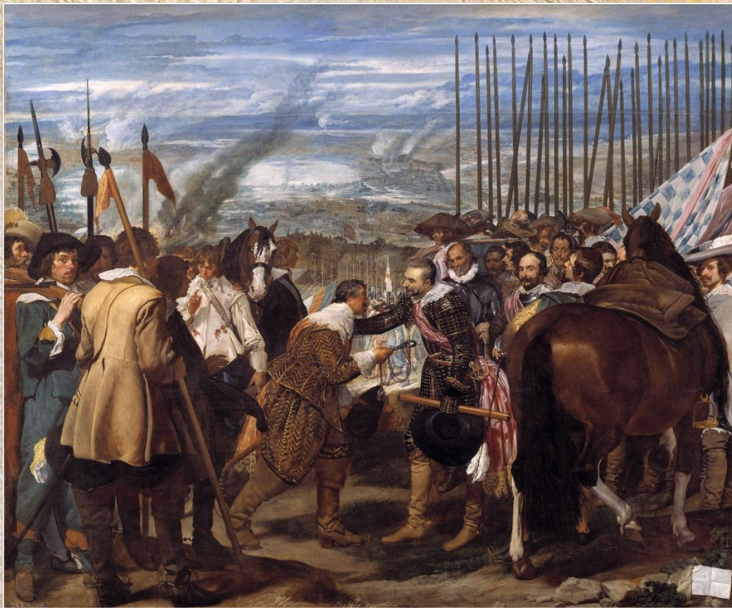
Диего Веласкес «Сдача Бреды»