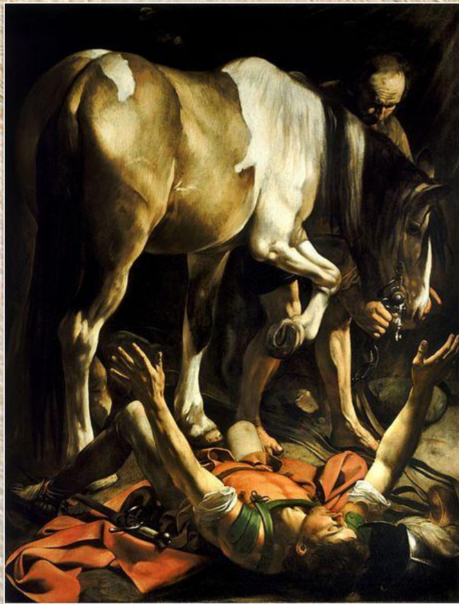
Караваджо «Обращение Савла»