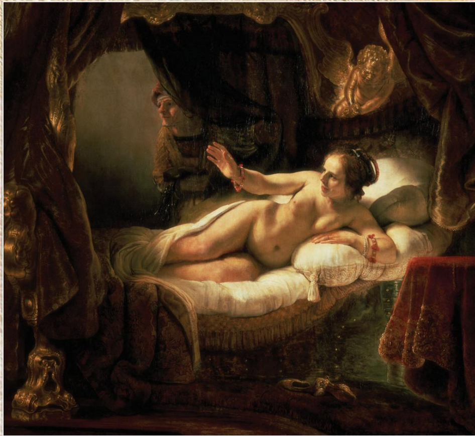
Рембрандт ван Рейн «Даная»