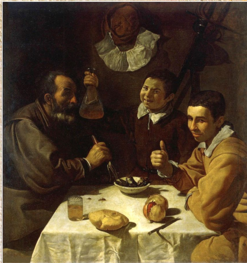
Диего Веласкес «Завтрак»