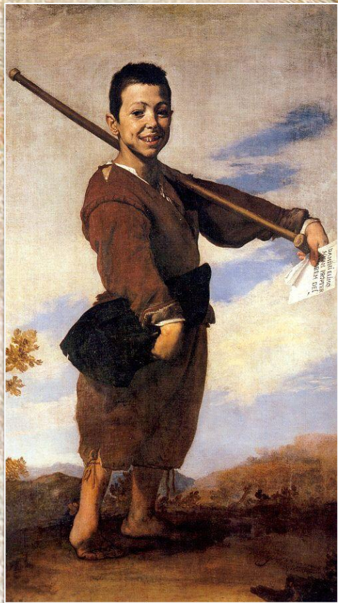
Хусепе Рибера «Хромоножка»