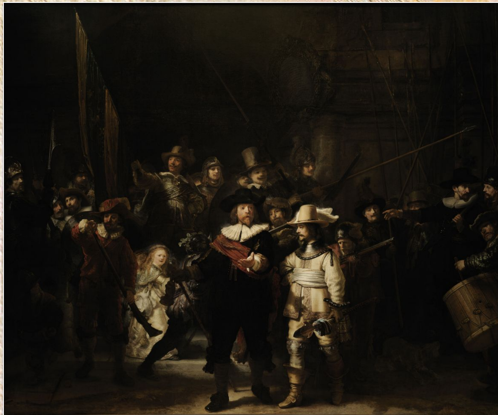
Рембрандт ван Рейн «Ночной дозор»