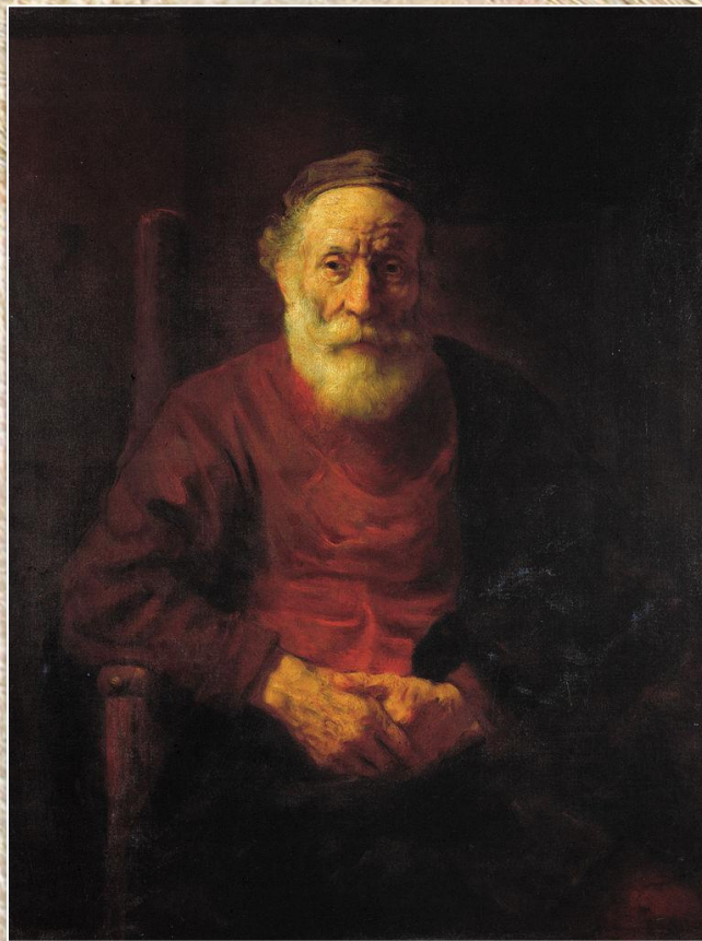
Рембрандт ван Рейн «Портрет старика в красном»