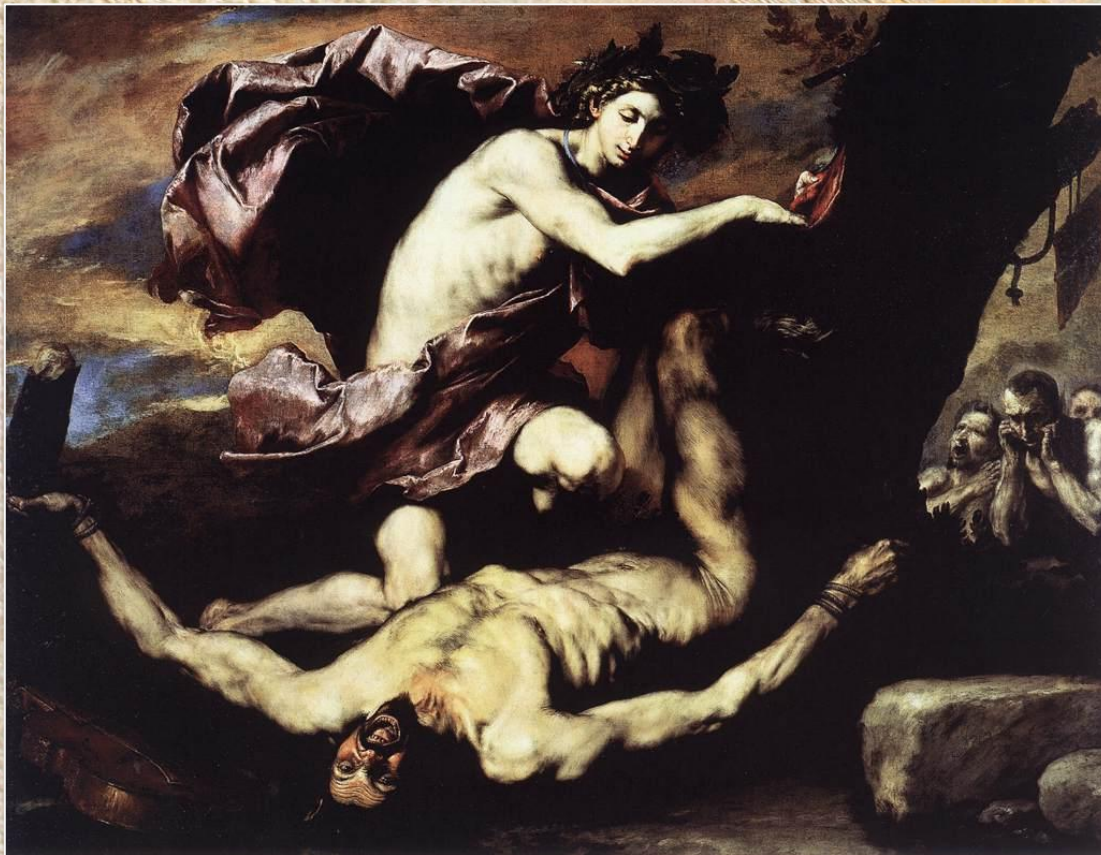
Хусепе Рибера «Аполлон и Марсий»