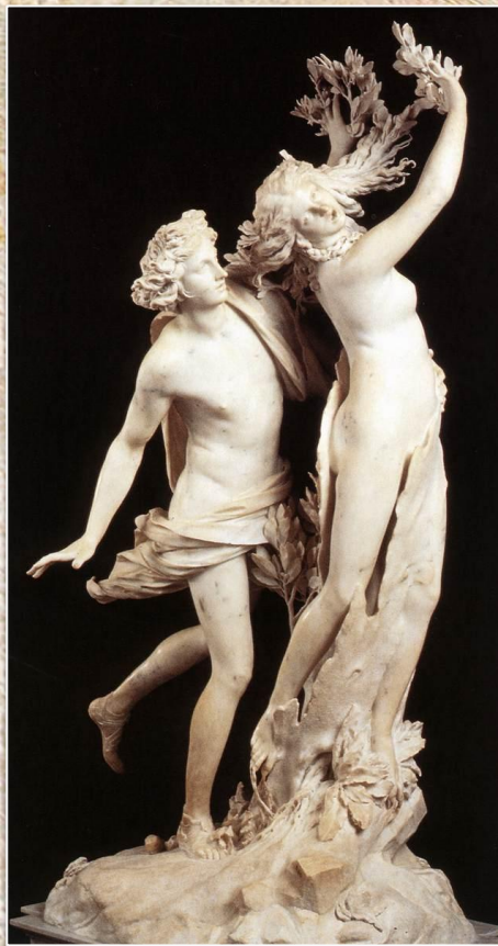
Лоренцо Бернини «Аполлон и Дафна»