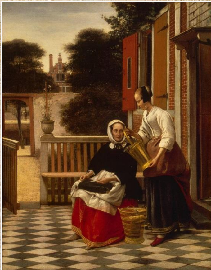
Питер де Хох «Хозяйка и служанка»