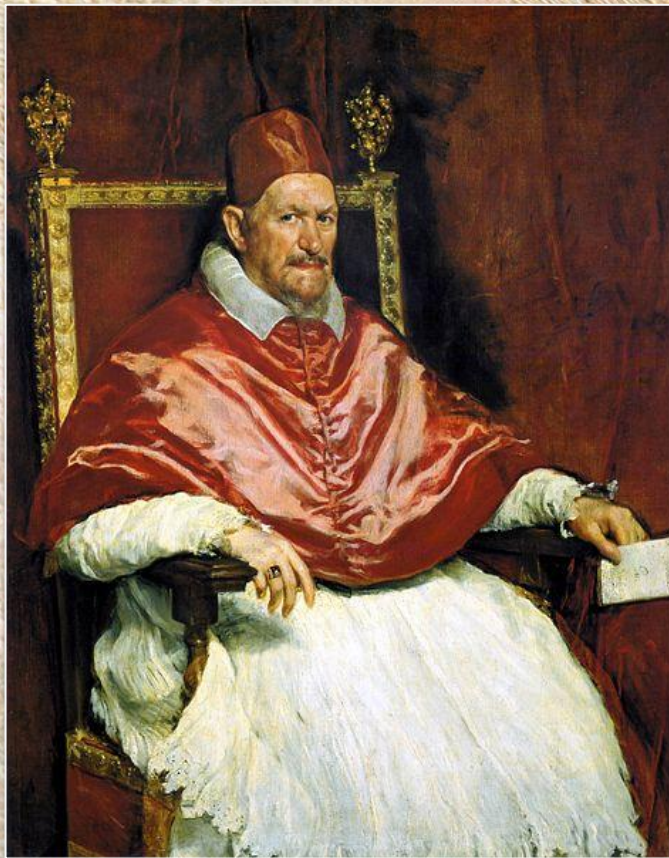
Диего Веласкес «Портрет папы Иннокентия X»