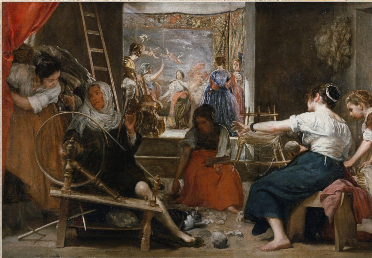
Диего Веласкес «Пряхи»