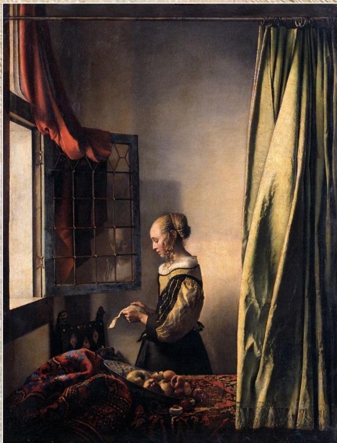
Ян Вермеер «Девушка с письмом»