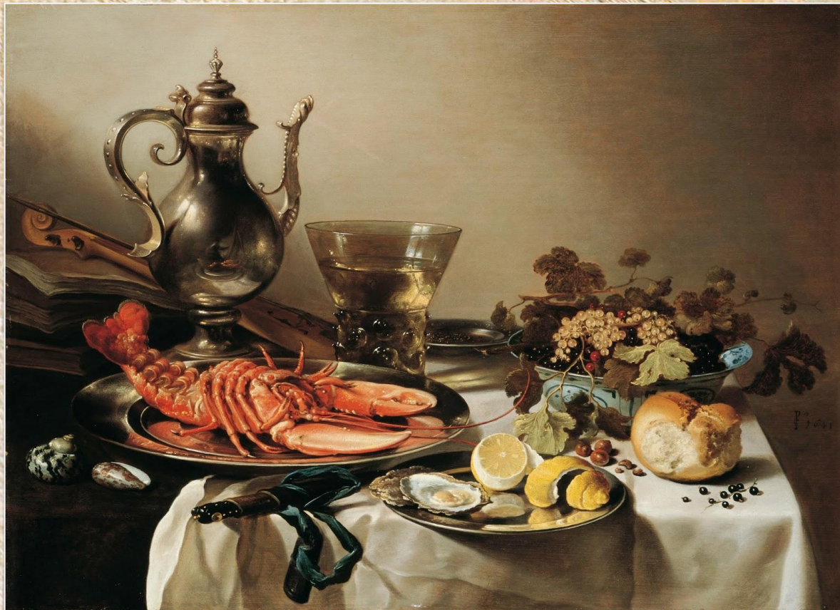
Питер Клас «Стол с лобстером и кувшином»