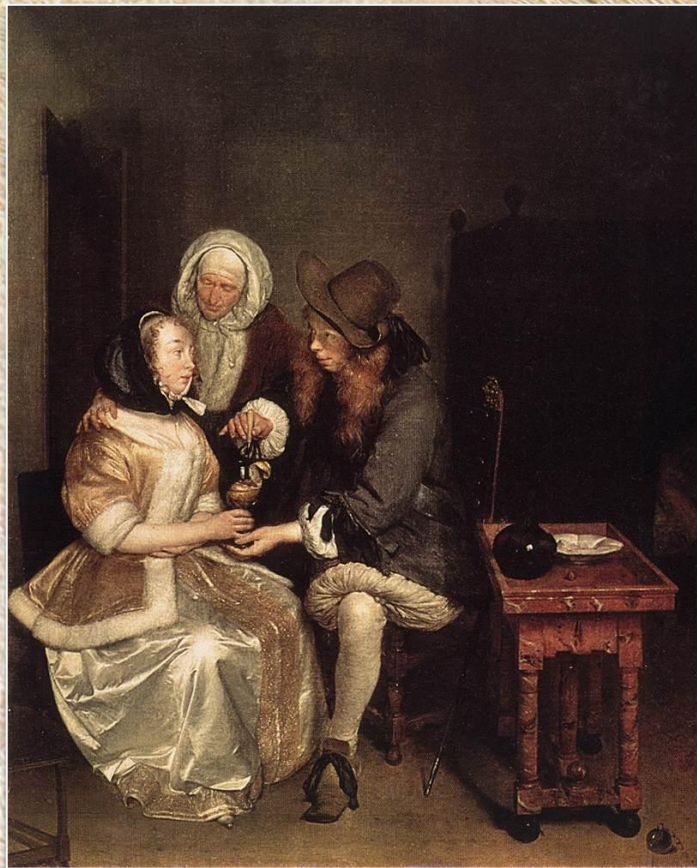
Герард Терборх «Бокал лимонада»