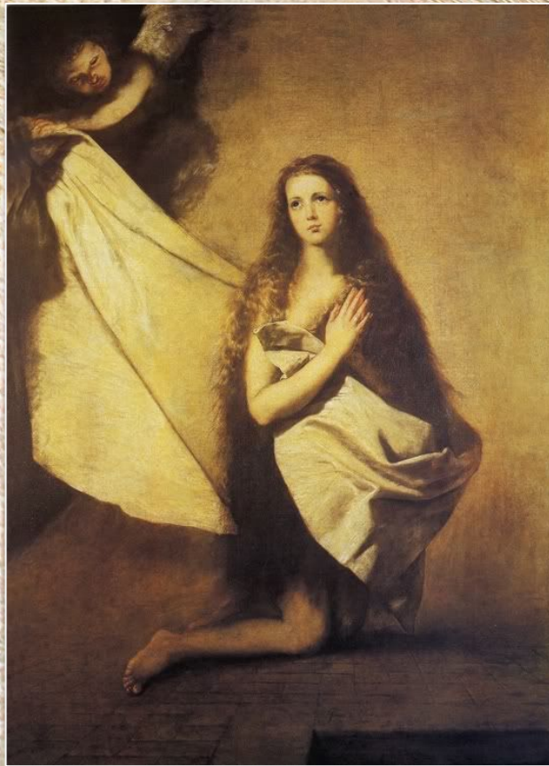
Хусепе Рибера «Святая Инесса»