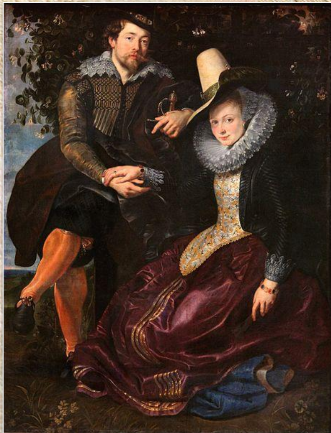
Питер Пауль Рубенс «Автопортрет с Изабеллой Брант»