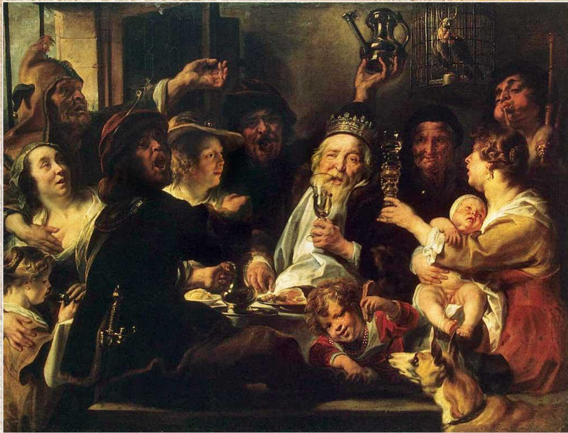
Якоб Йорданс «Бобовый король»