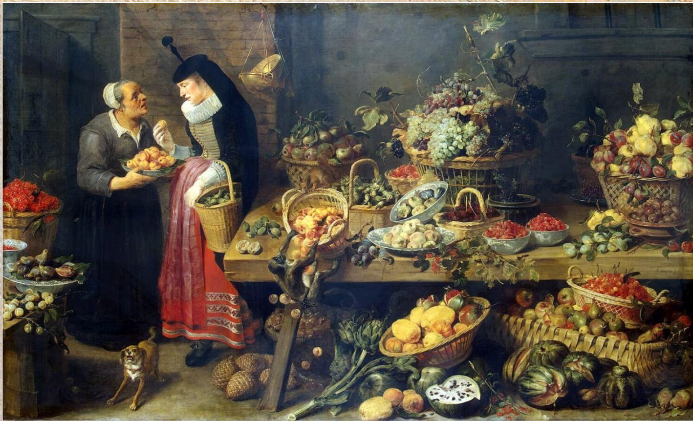
Франс Снейдерс «Фруктовая лавка»