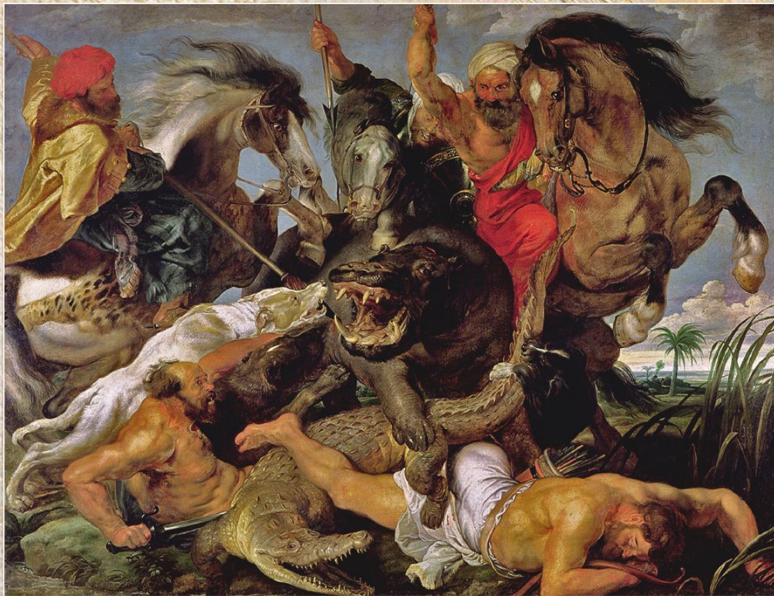
Питер Пауль Рубенс «Охота на гиппопотама»