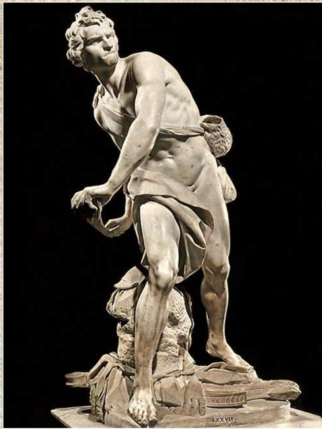
Лоренцо Бернини «Давид»