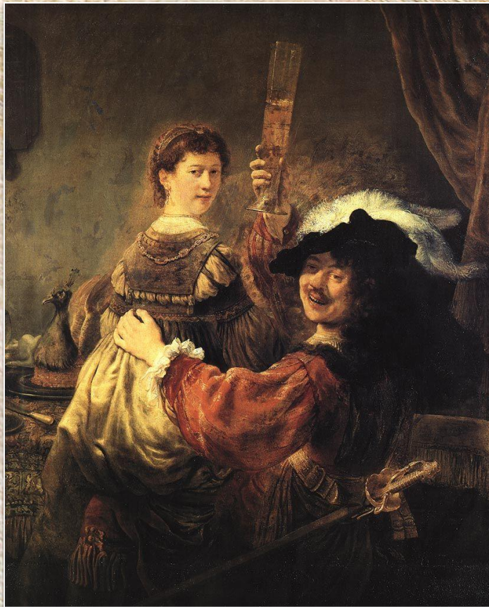
Рембрандт ван Рейн «Автопортрет с Саскией на коленях»