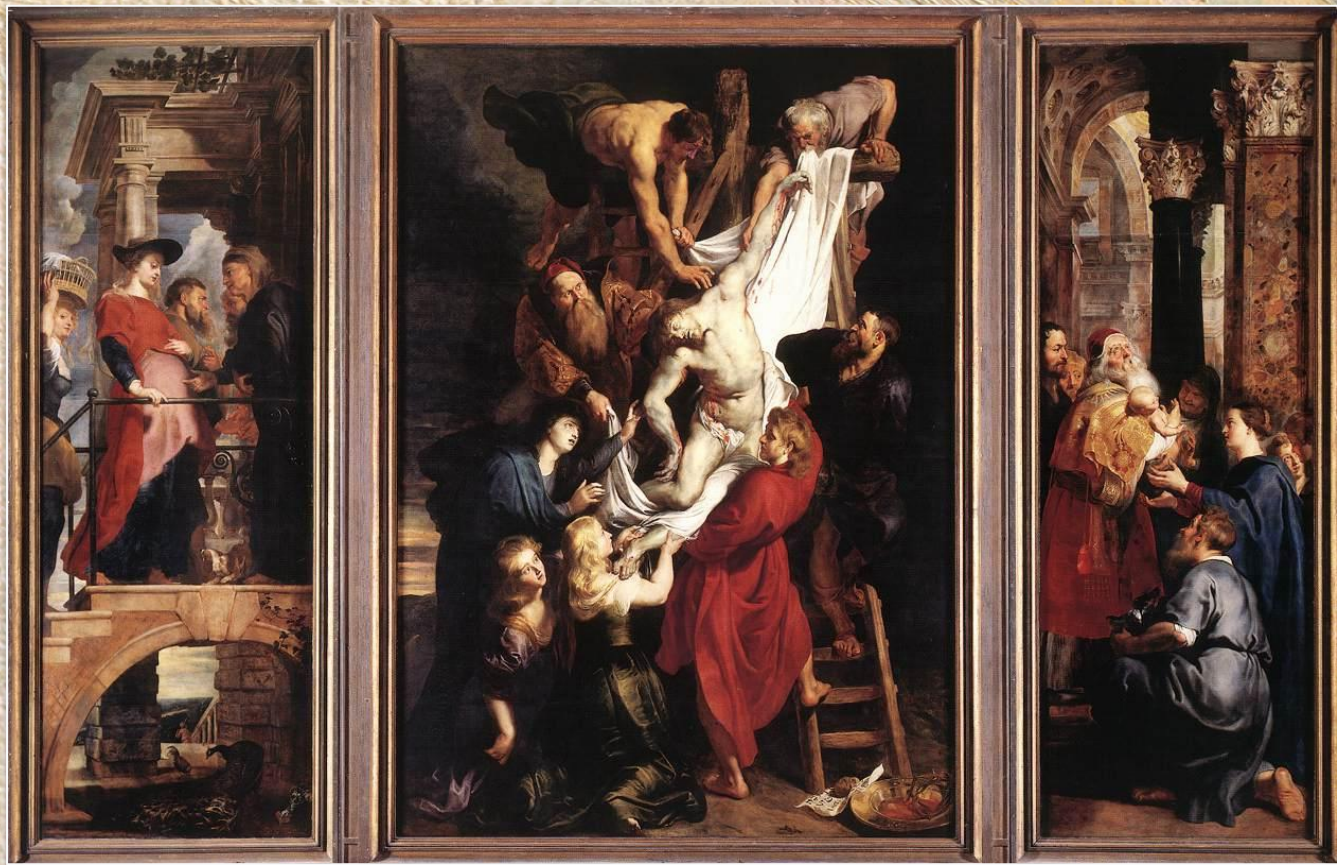
Питер Пауль Рубенс «Снятие с креста»