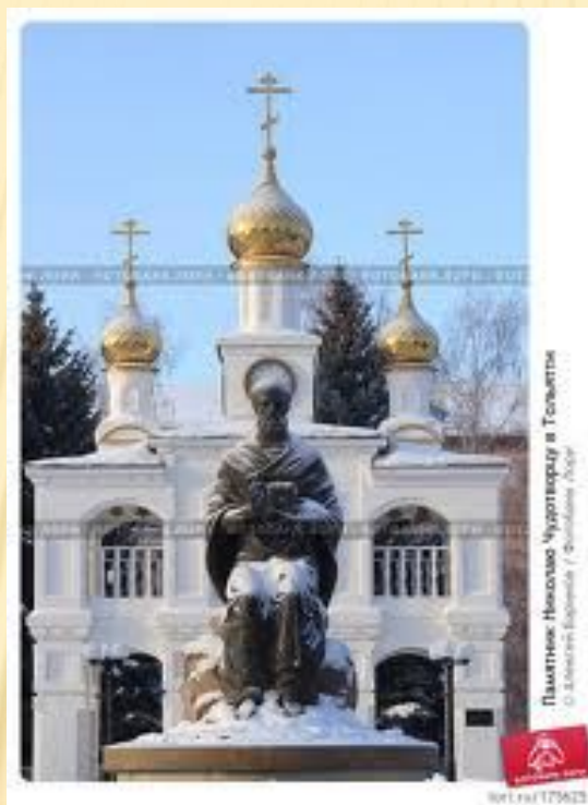
Памятник Николаю Чудотворцу в Тельявине