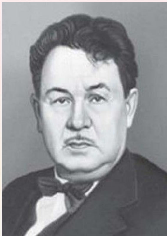
Александр Михайлович Герасимов 1881 - 1963