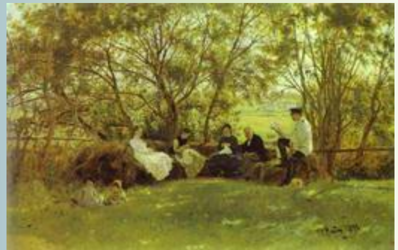
Художник - И. Репин «На дерновой скамье»