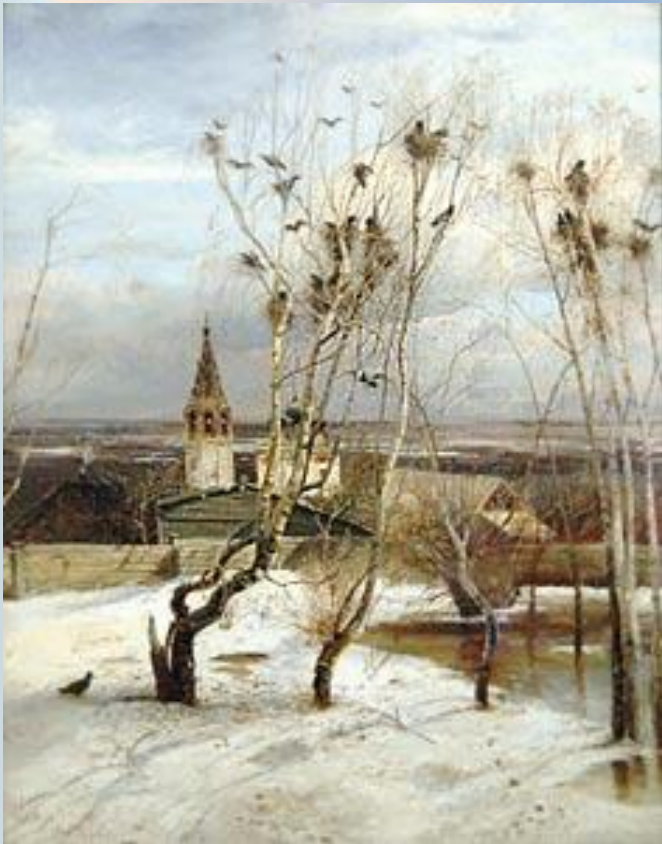
Художник - А. Саврасов «Грачи прилетели»