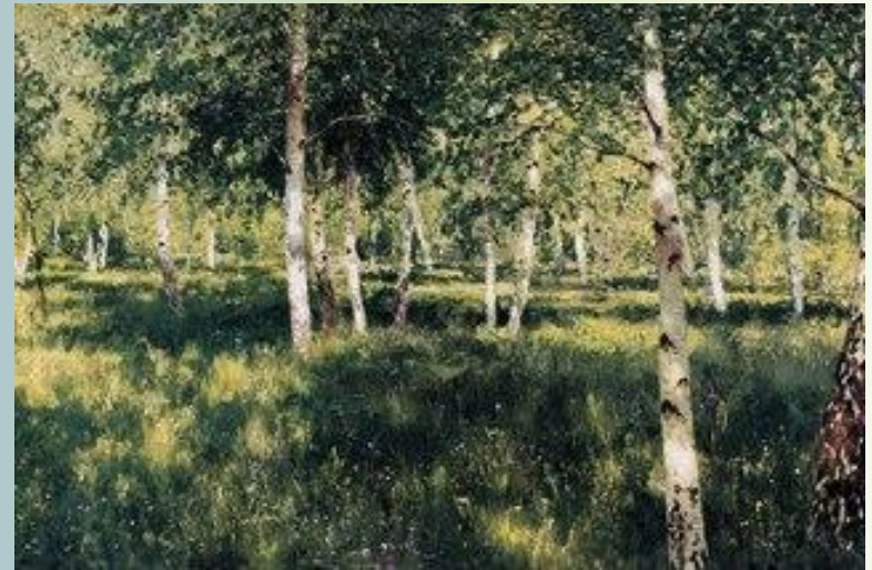
Художник - И. Левитан «Березовая роща»