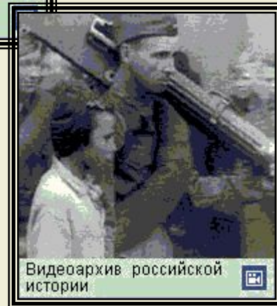
Видеоархив российской истории

Во время Великой Отечественной войны А.Барто выезжала на фронт с чтением своих стихов, выступала по радио, писала для газет.