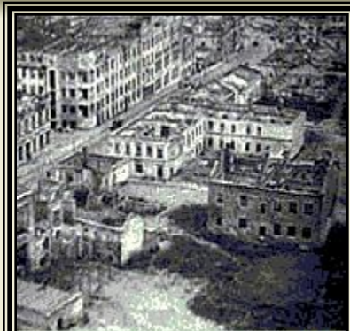
Видеоархив российской истории