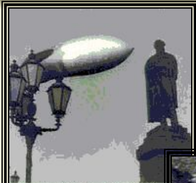
Видеоархив российской истории