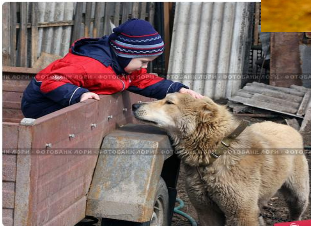
Мальчик гладит собаку