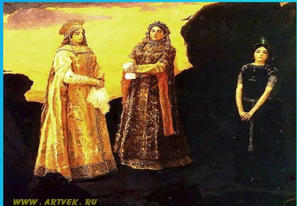
«Три царевны Тёмного царства»