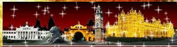
Знакомство с городом