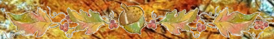
Наблюдения в мире растений