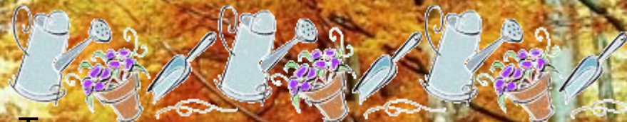
Труд в природе