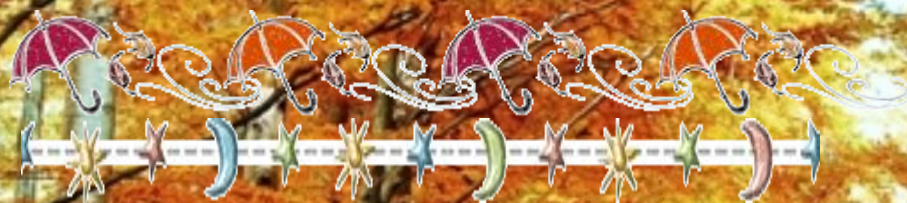
Наблюдения в неживой природе