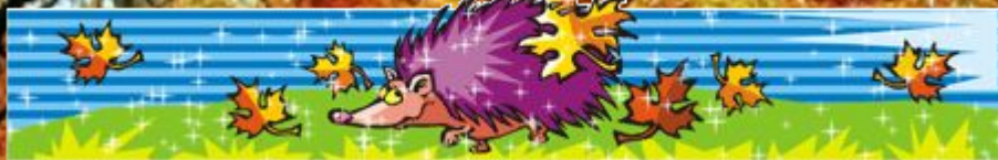
Наблюдения в мире животных