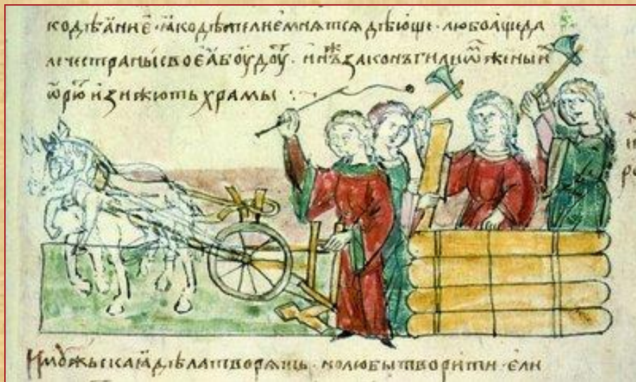
Возведение стен и распашка земель. Миниатюра из Радзивильской летописи. XV в (БАН.34.5.30.Л.7)