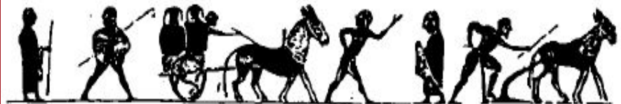
Земледельцы Древней Спарты