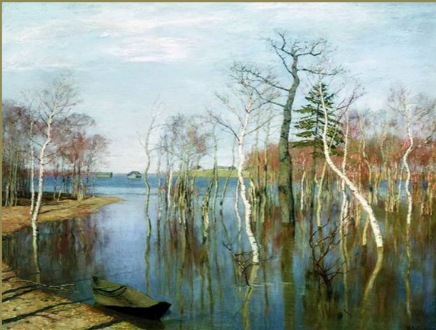
И.И. Левитан «Весна – большая вода»