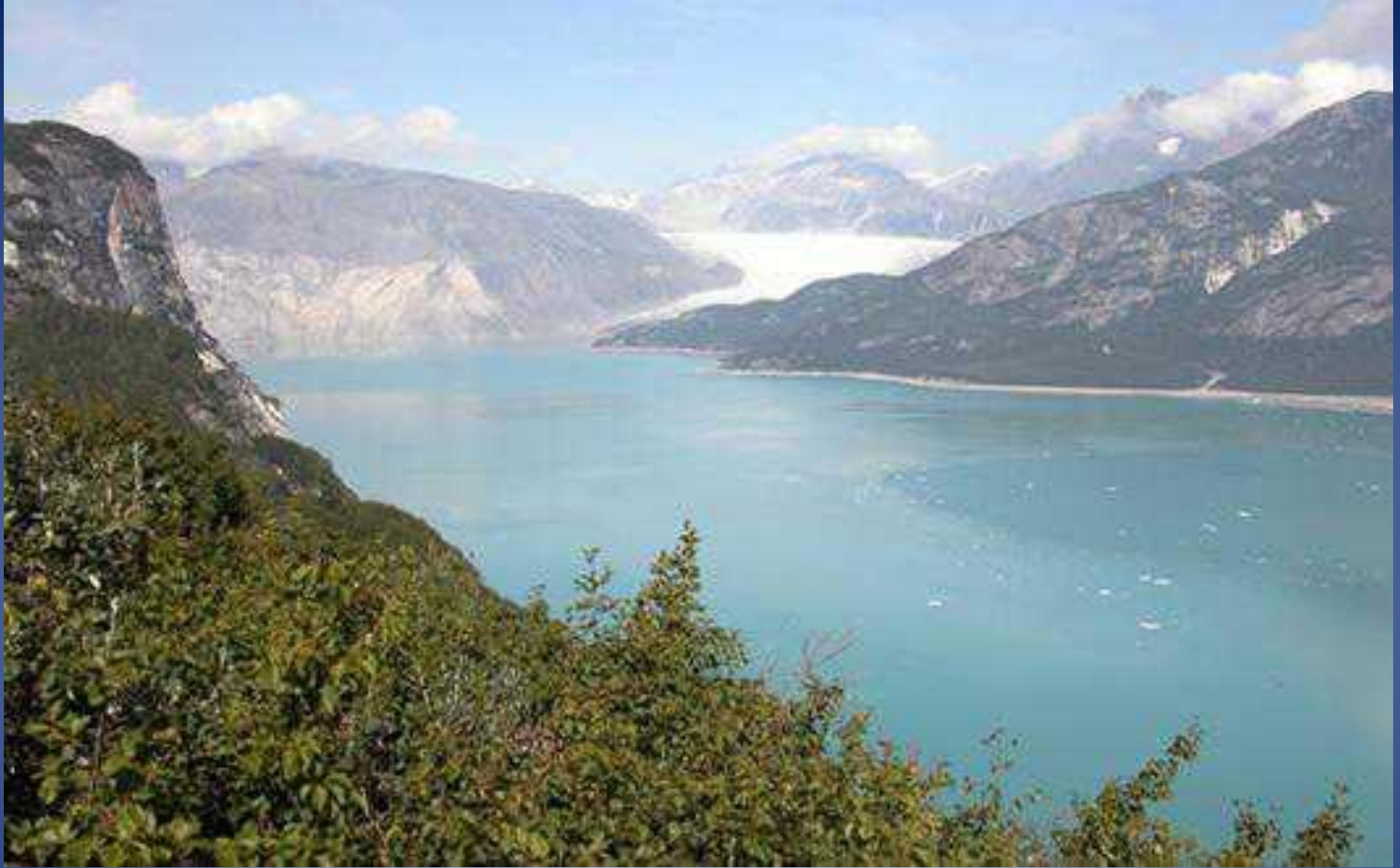
Ледник Муир (2004 год)