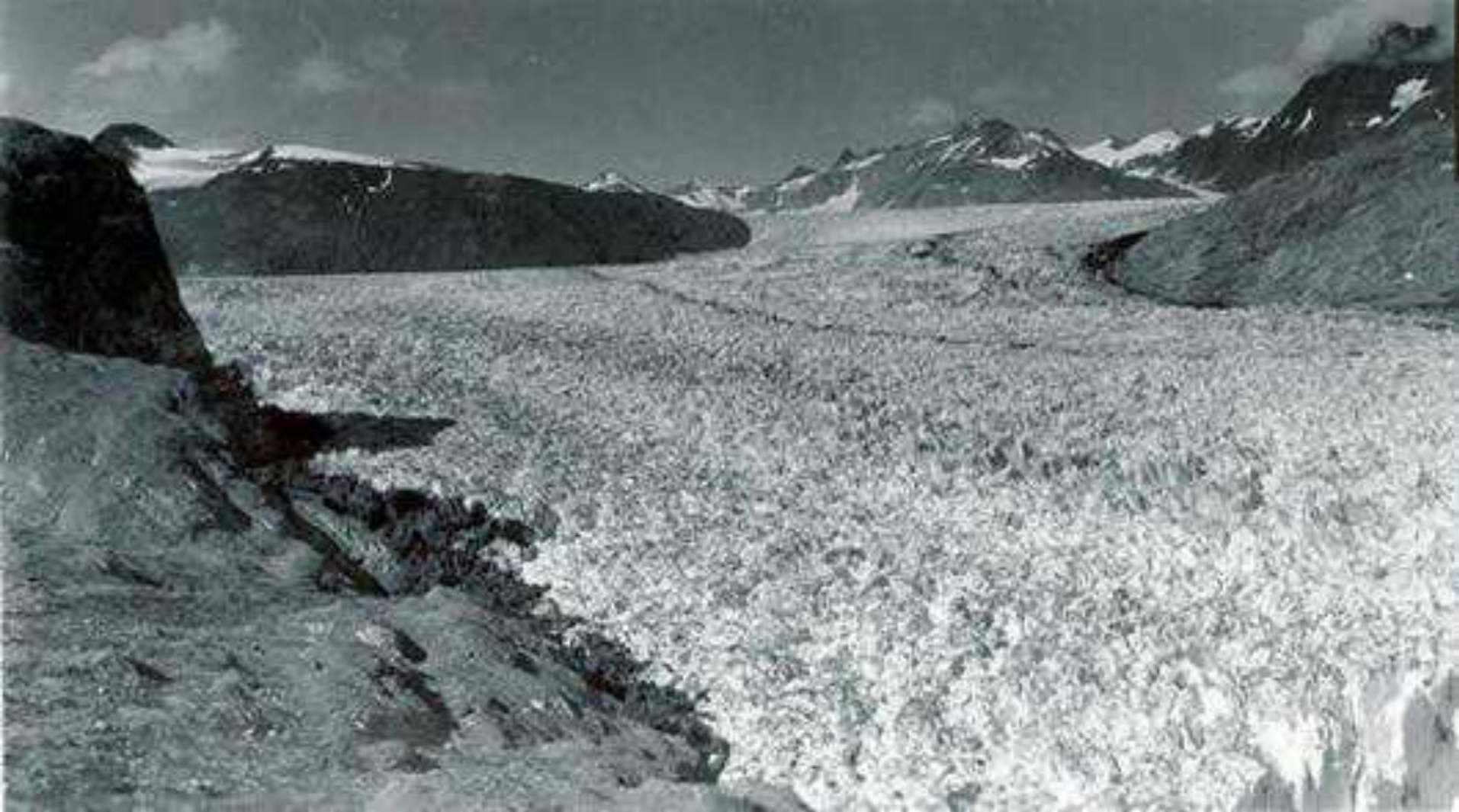
Ледник Муир (1949 год)