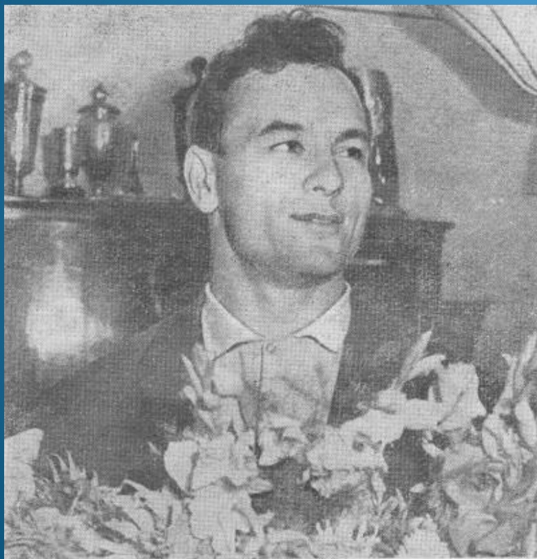
Александр Курынов, чемпион мира и олимпийских игр.

Родился 8 июля 1934 года в посёлке Уршель Владимирской области.