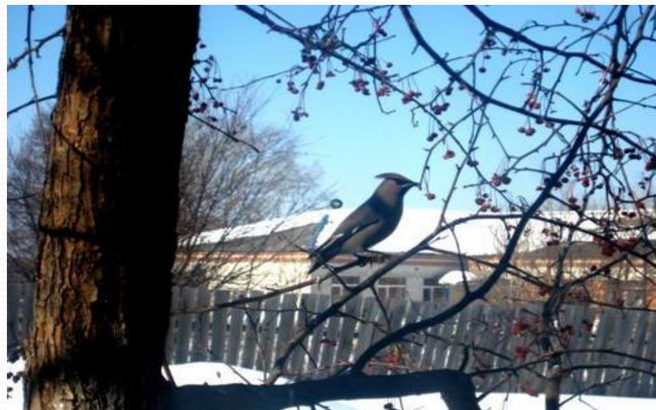
Перламутровка пафия, жук олень, свиристель, дятел.