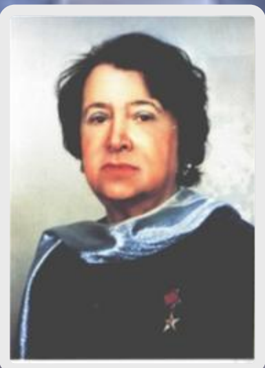
Наталья Ильинична Сац