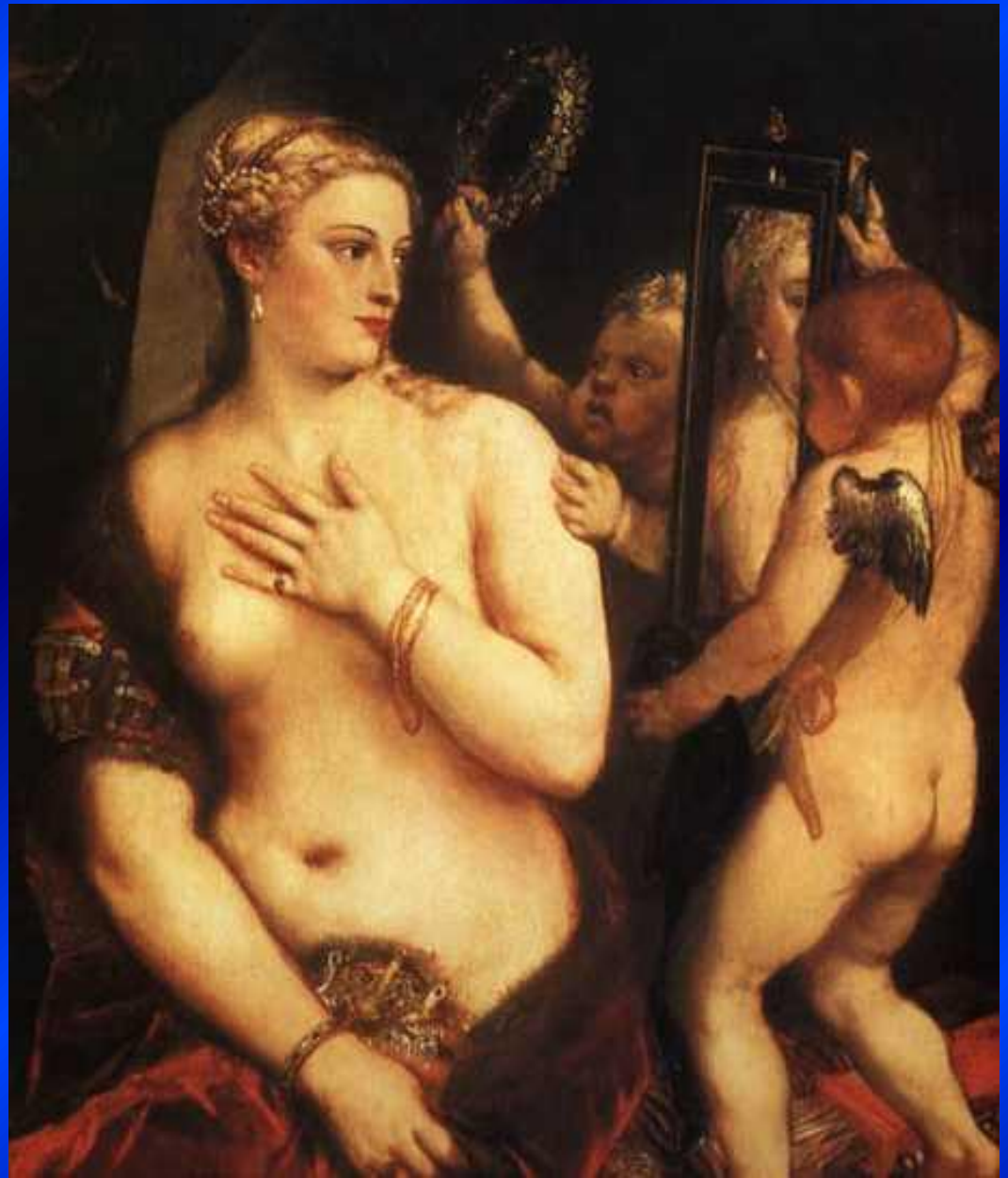
Паоло Веронезе – «Венера у зеркала»

Высокое Возрождение приносит совсем иное понимание красоты. Вместо тонких, стройных подвижных фигур торжествуют пышные формы, могучие тела с широкими бедрами, с роскошной полнотой шеи и плеч.