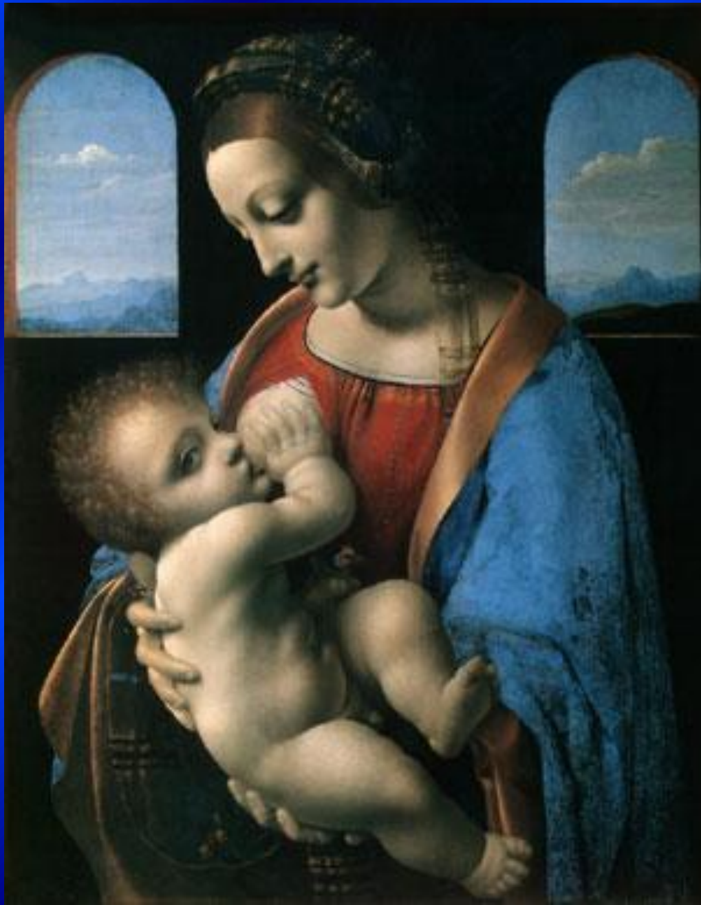
Леонардо – «Мадонна Литта»