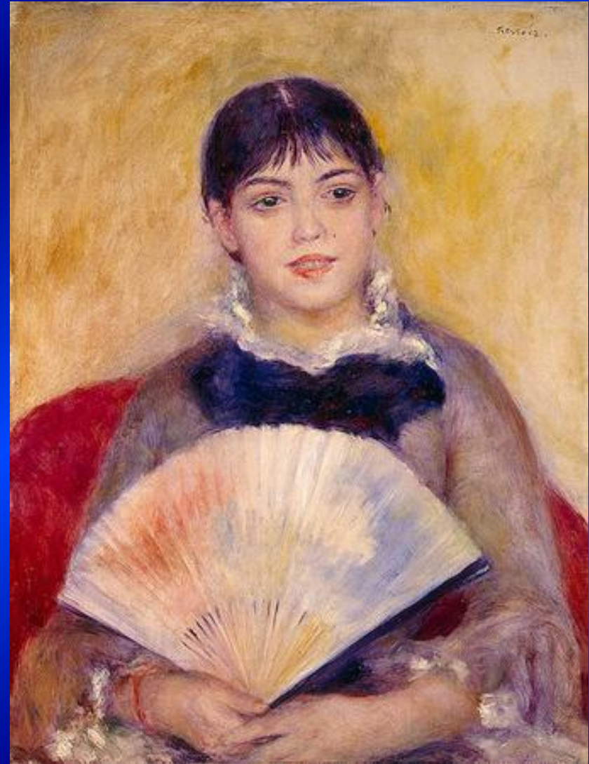
Рененуар – «Дама с веером»

В конце 19 века в восприятии женской красоты произошли коренные перемены. Торжествуют естественность, неповторимость облика, женственность.