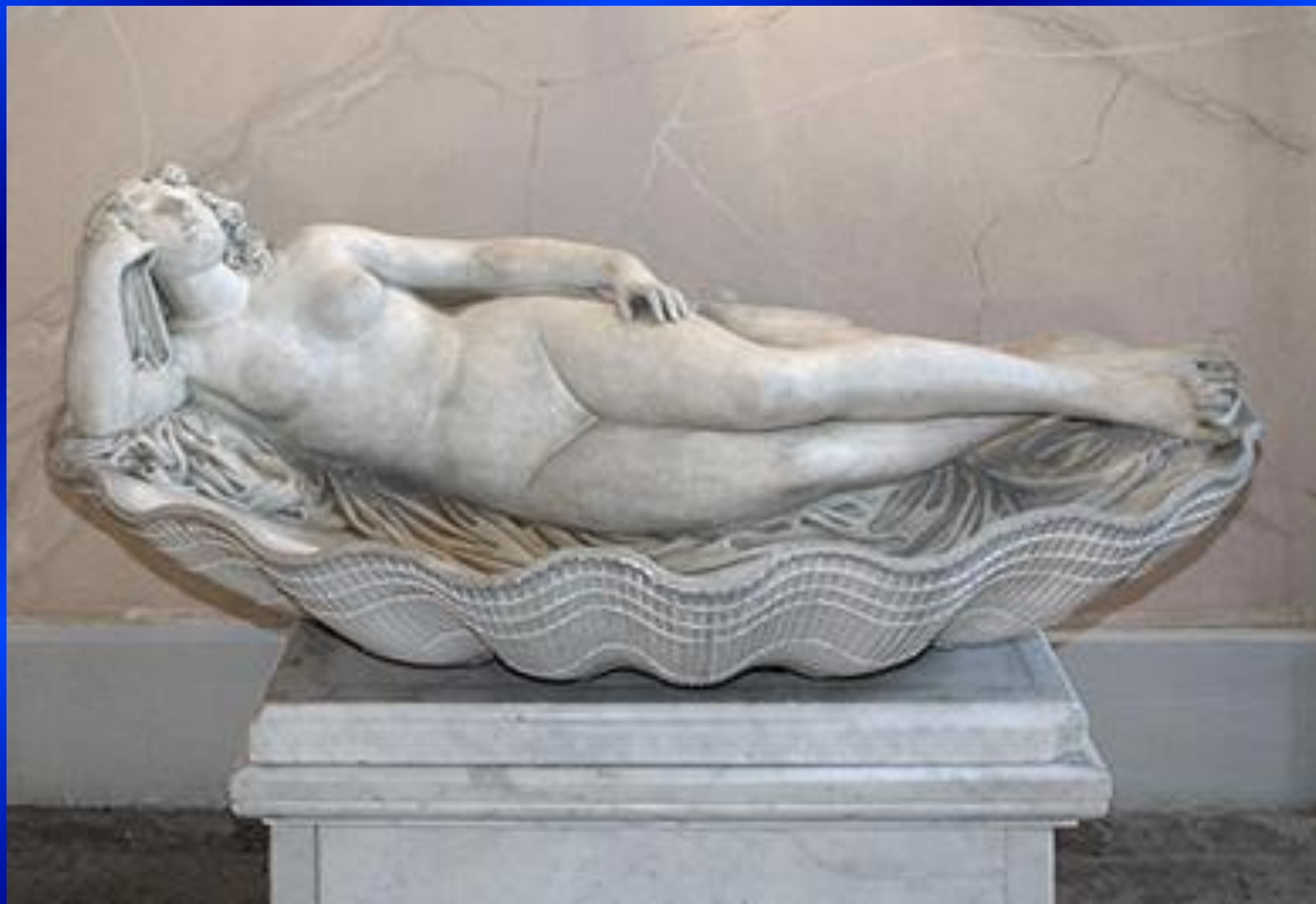
Скульптура Афродиты (Венеры)