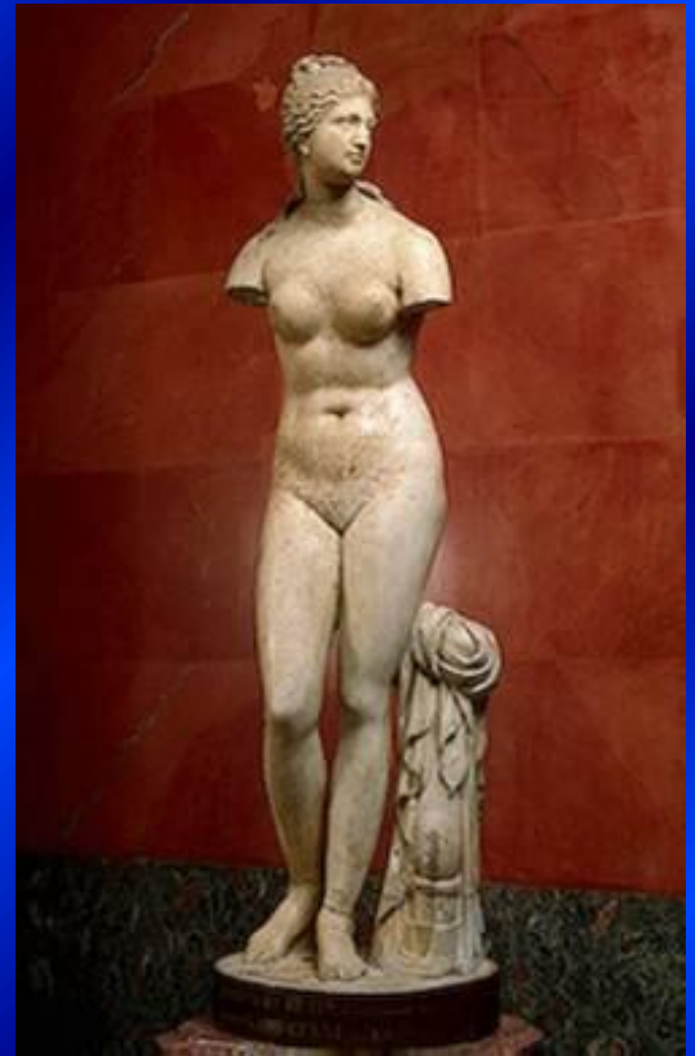
Скульптура Афродиты (Венеры)